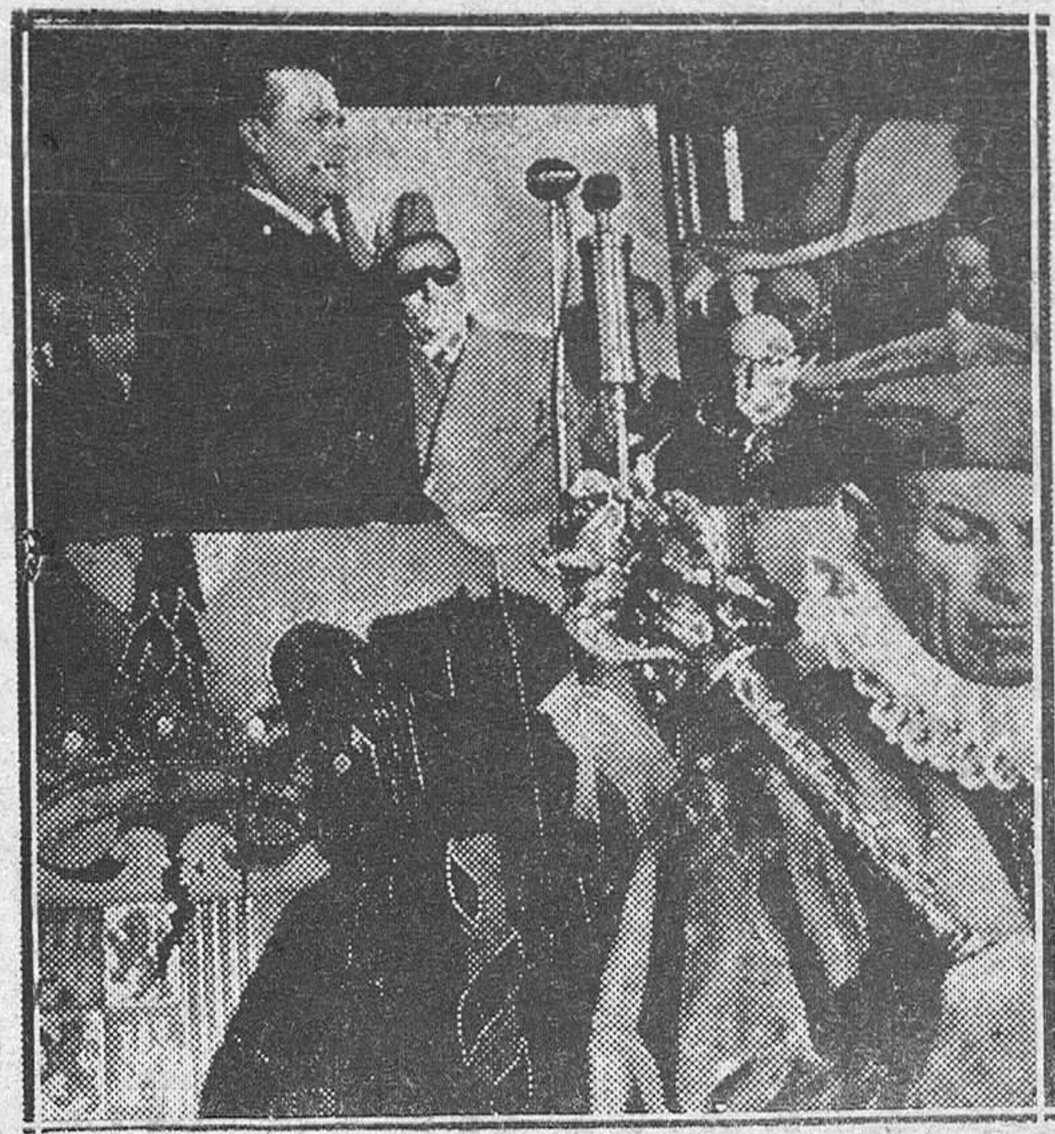
TOLEDO.—El cardenal primado bendijo, y el ministro de la Gobernación inauguró, un gran bloque de viviendas económicas, construido por Regiones Devastadas, en la Avenida de la Reconquista de esta capital.—La "foto" muestra un momento del acto.