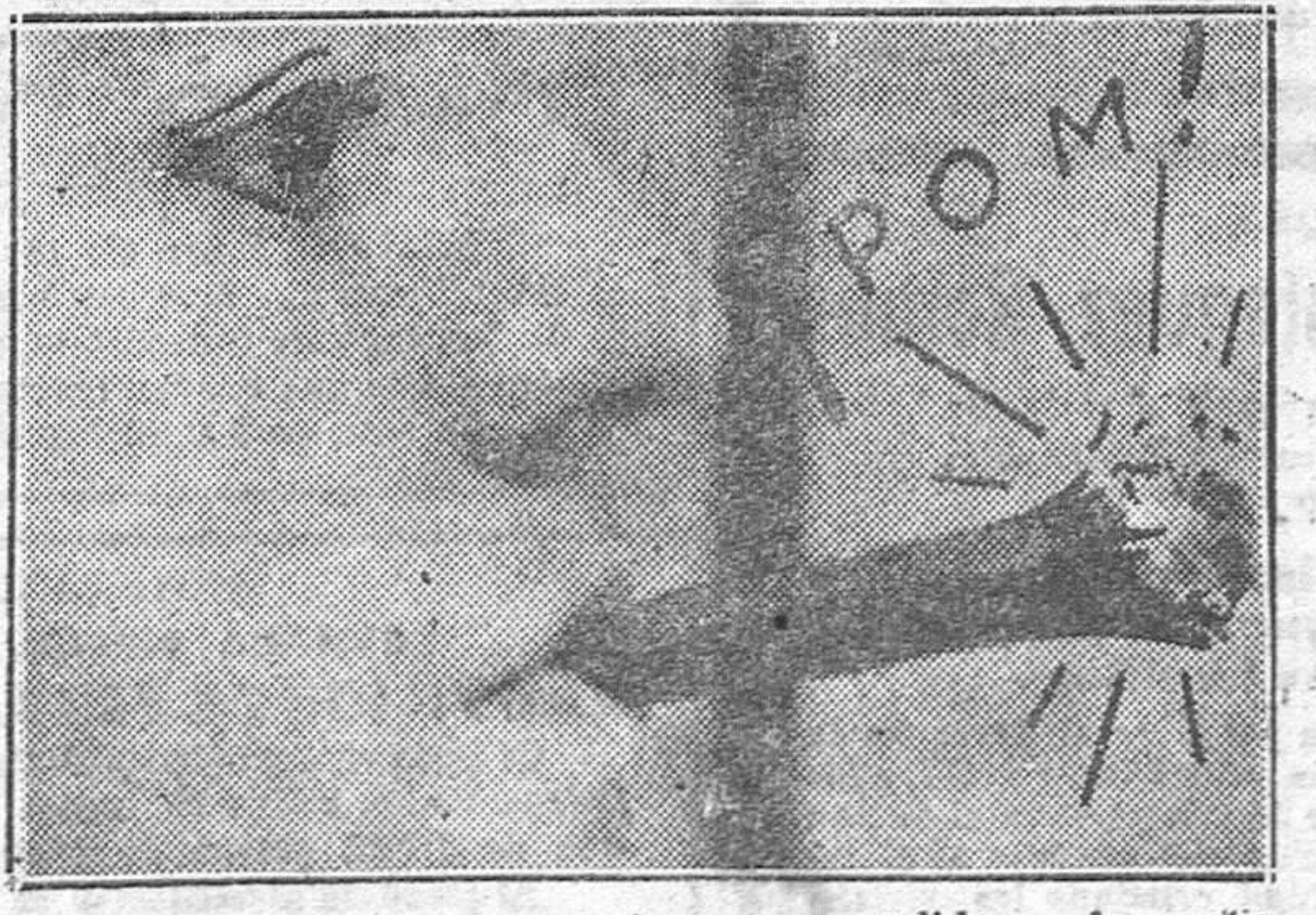
Antiguamente los puros explosivos eran vendidos en las verbenas. Hoy, los puede usted adquirir en los estancos.