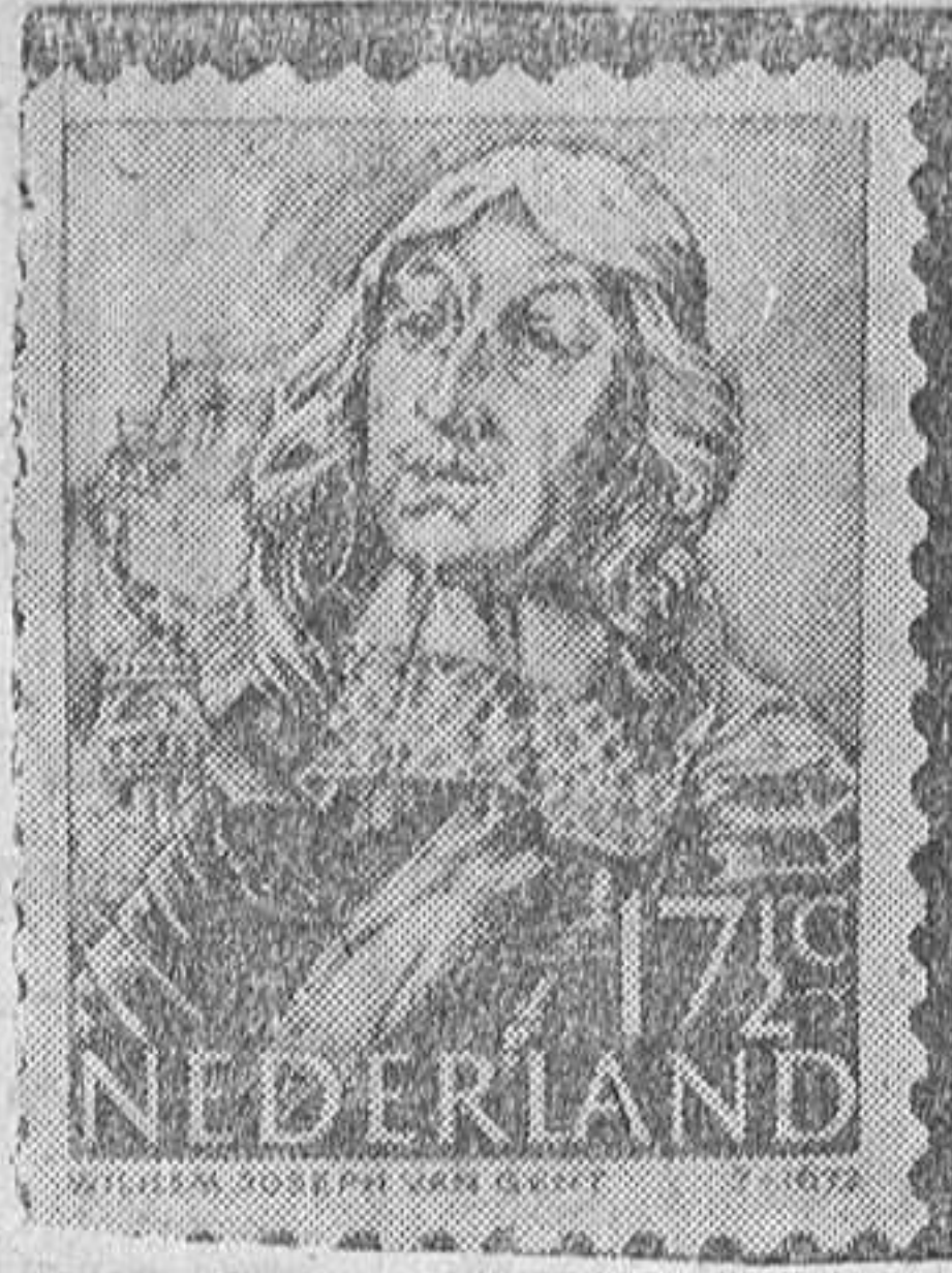
Nuevo sello de los Países Bajos con valor de 17,5 cents. que lleva la imagen de Willen Joseph van Gent.