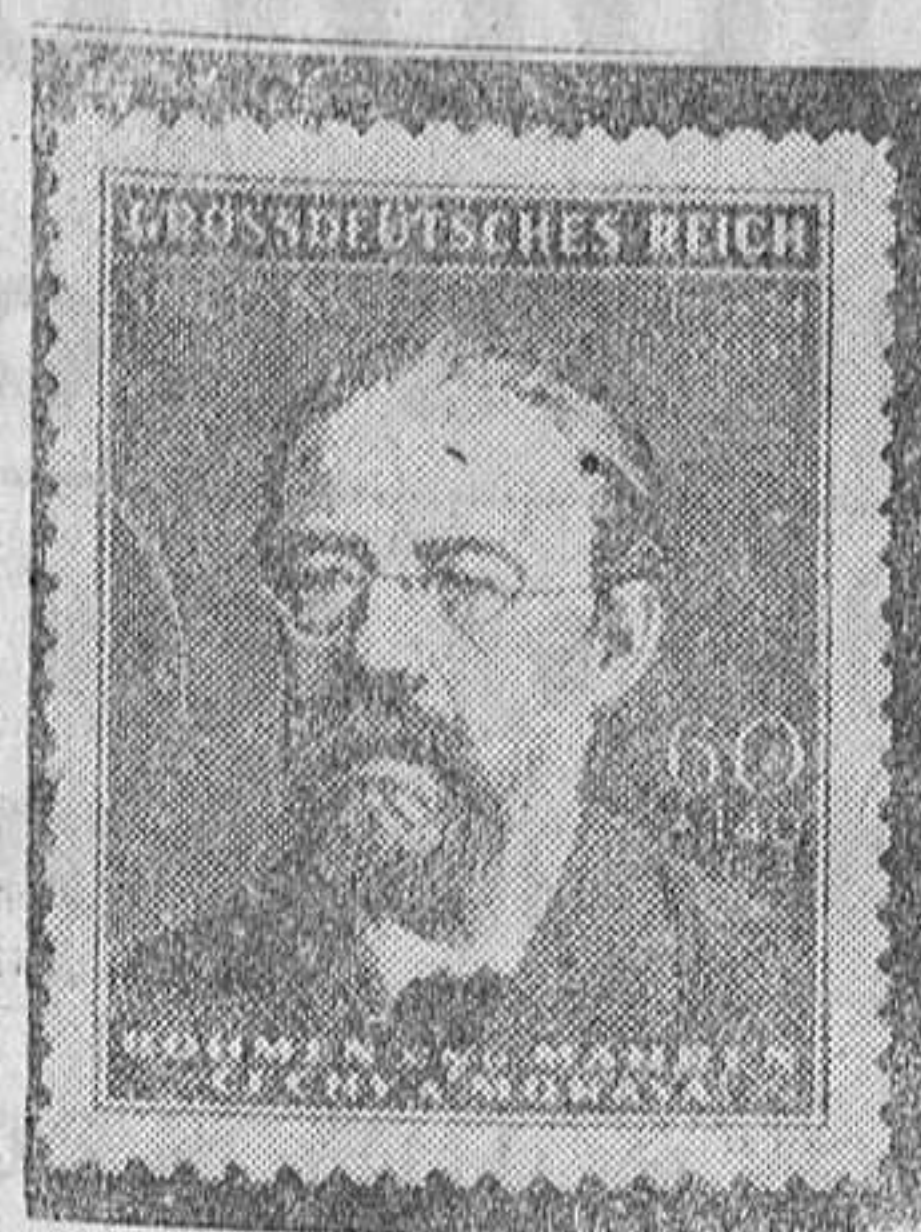
Con motivo del 50 aniversario del fallecimiento del compositor Smetana el Ministerio de Comunicaciones de Bohemia y Moravia ha lanzado un nuevo sello que lleva la imagen del célebre compositor. Este sello circulará hasta fin del mes de septiembre de 1945.