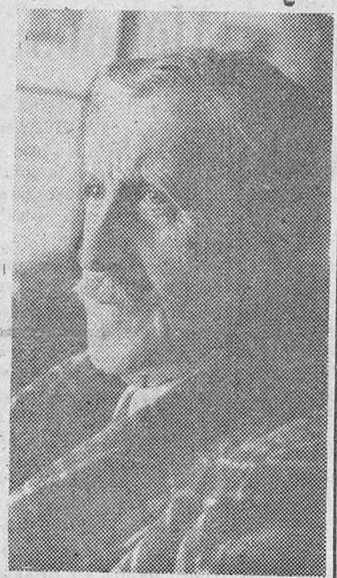
Una de las últimas fotografías de don Joaquín Álvarez Quintero, gloria del teatro español, fallecido en Madrid.