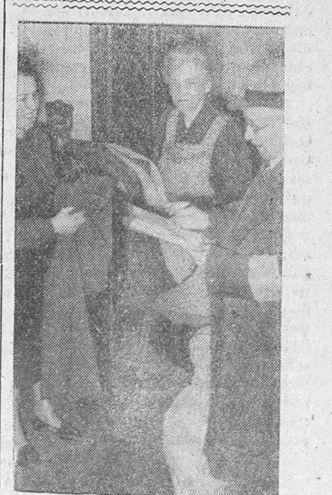
Con el fin de volver a confeccionar prendas de vestir, en Alemania se ha hecho una recogida de ropas usadas.