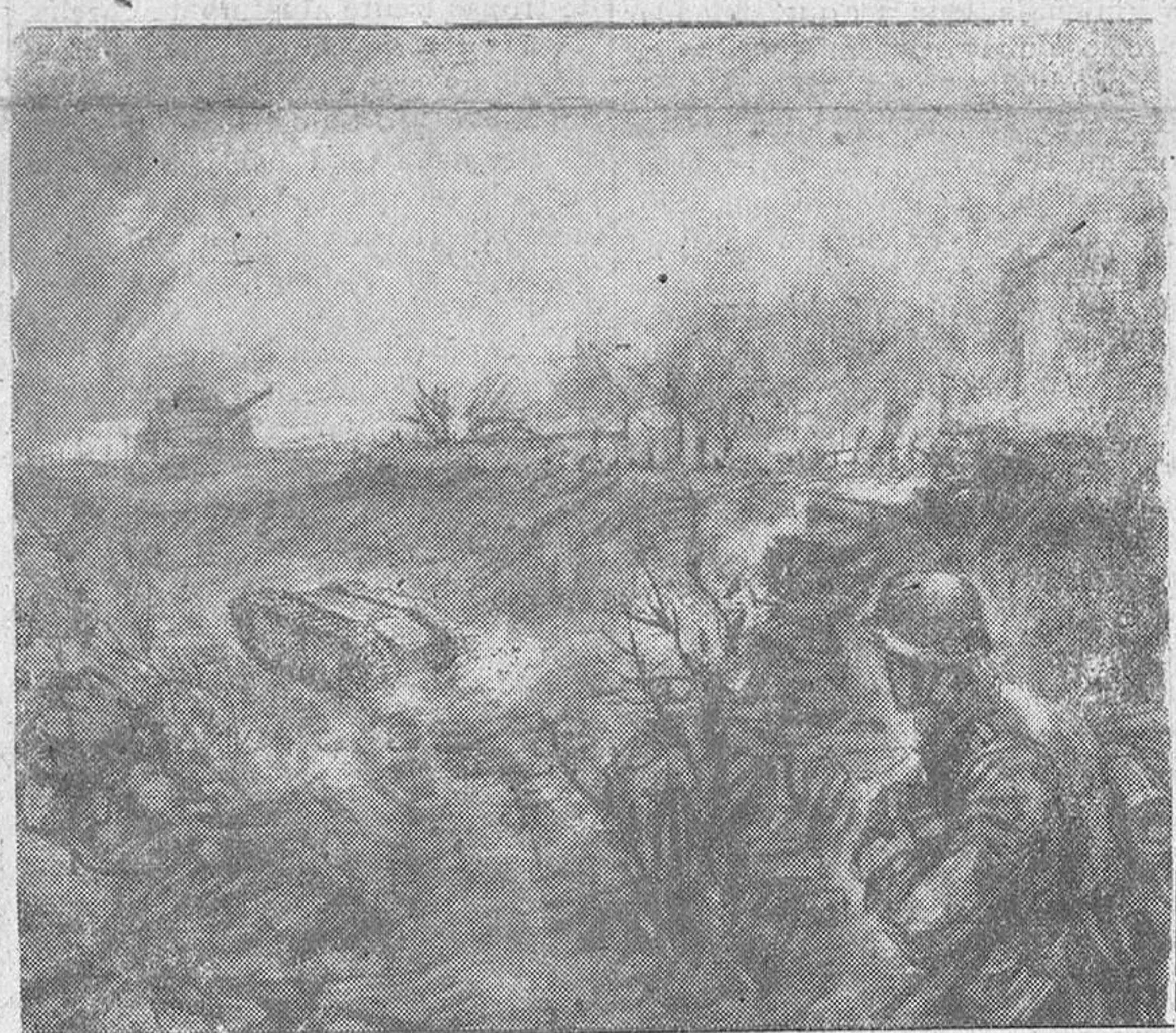
El dibujo de un corresponsal de guerra alemán que hoy ofrecemos a nuestros lectores refleja el momento en que el minúsculo nuevo tanque «Goliat» entra en acción para repeler una agresión de tanques soviéticos.

CUARTEL GENERAL DEL FUHRER, 24.—El alto mando de las fuerzas armadas alemanas comunica: