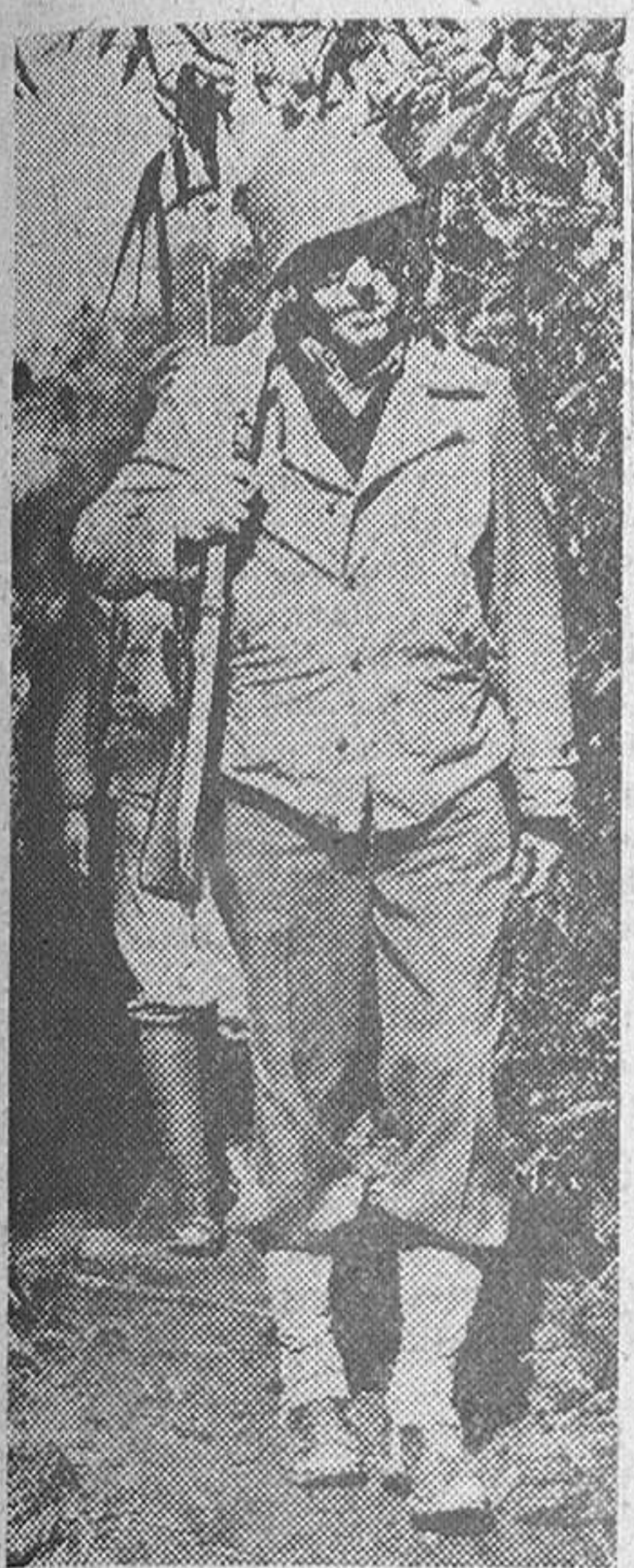
Con su carabina al hombro, el teniente general Stilwell marcha por la jungla durante su visita al frente del Norte de Birmania.

Las fuerzas japonesas ocupan Paletwa, punto de apoyo inglés en el Valle de Kaladan