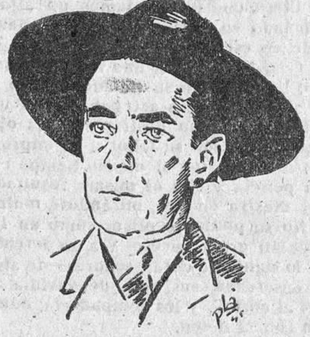
EL CONDE BERNADOTTE

RECHAZADOS AMMAN, 4. —Un comunicado árabe indica que las tropas del Irak han rechazado los ataques lanzados por las fuerzas judías en el (Termina en 4.ª pág. quinta col.)