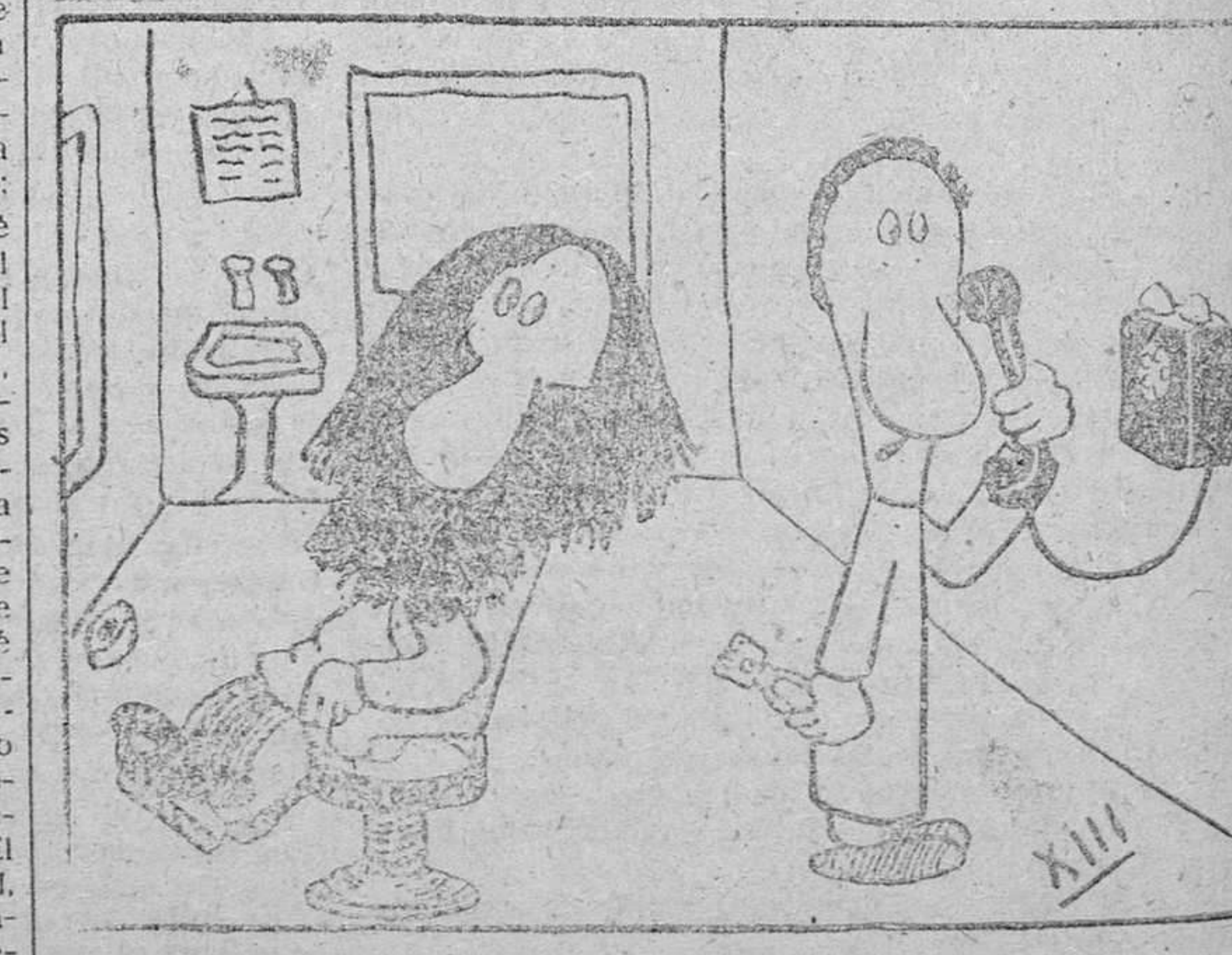
—Dile a mamá que hasta la semana que viene no puedo ir a casa

NEW YORK, 26.—Más de la mitad de los súbditos checoslovacos que actualmente se hallan en los Estados Unidos y que habían reservado pasaje para dirigirse en el próximo verano a su país, han anulado sus peticiones que ascendían a unas trescientas.—Efe.