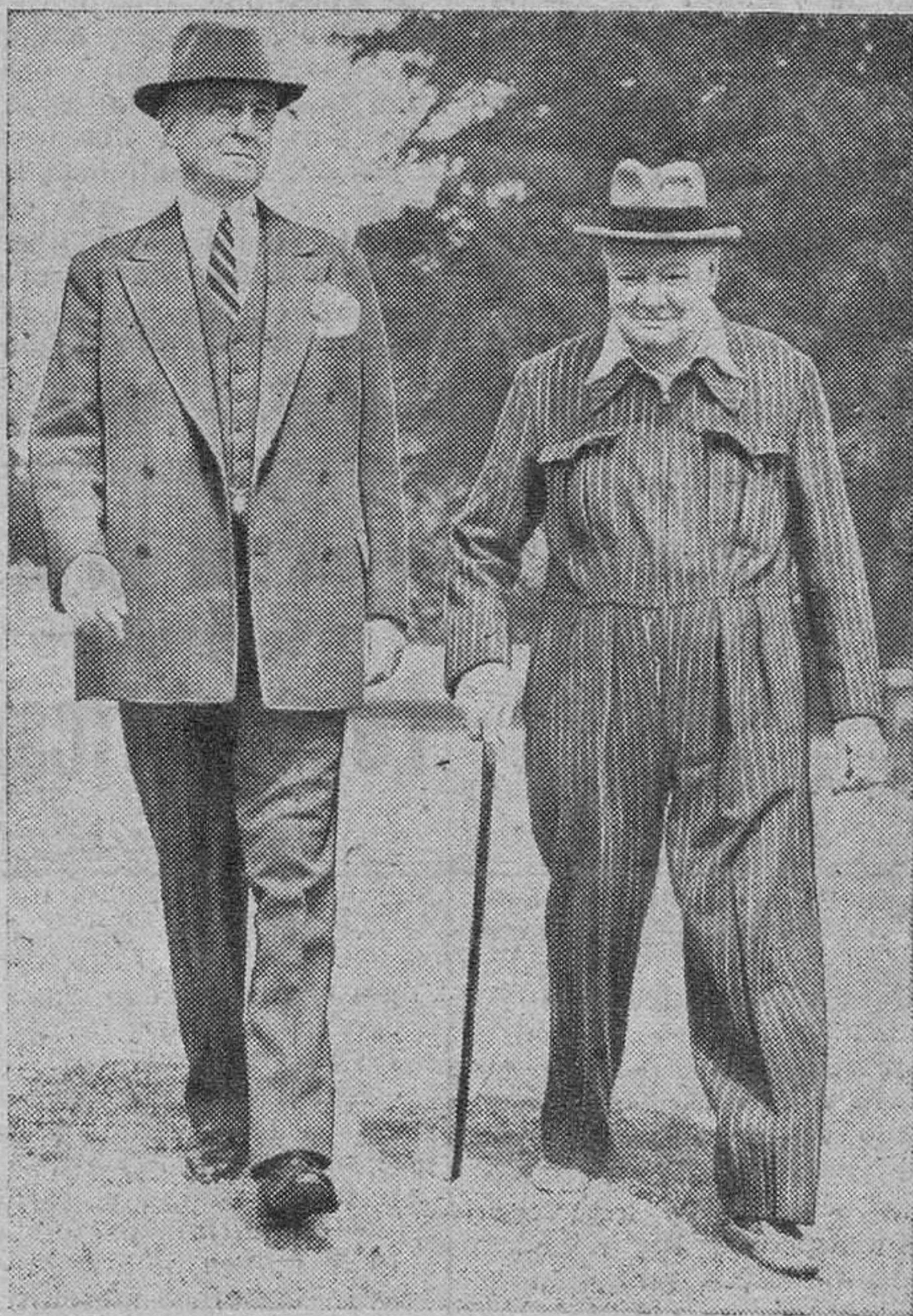
Por el jardín de su finca de reposo, pasea sonriente el ex primer británico Mr. Churchill, vistiendo su clásico monom a rayas. Le acompaña el eminente economista norteamericano Bernard Mannes Baruch, con quien el jefe conservador discutió los graves problemas económicos británicos y las consecuencias de la devaluación de la libra.