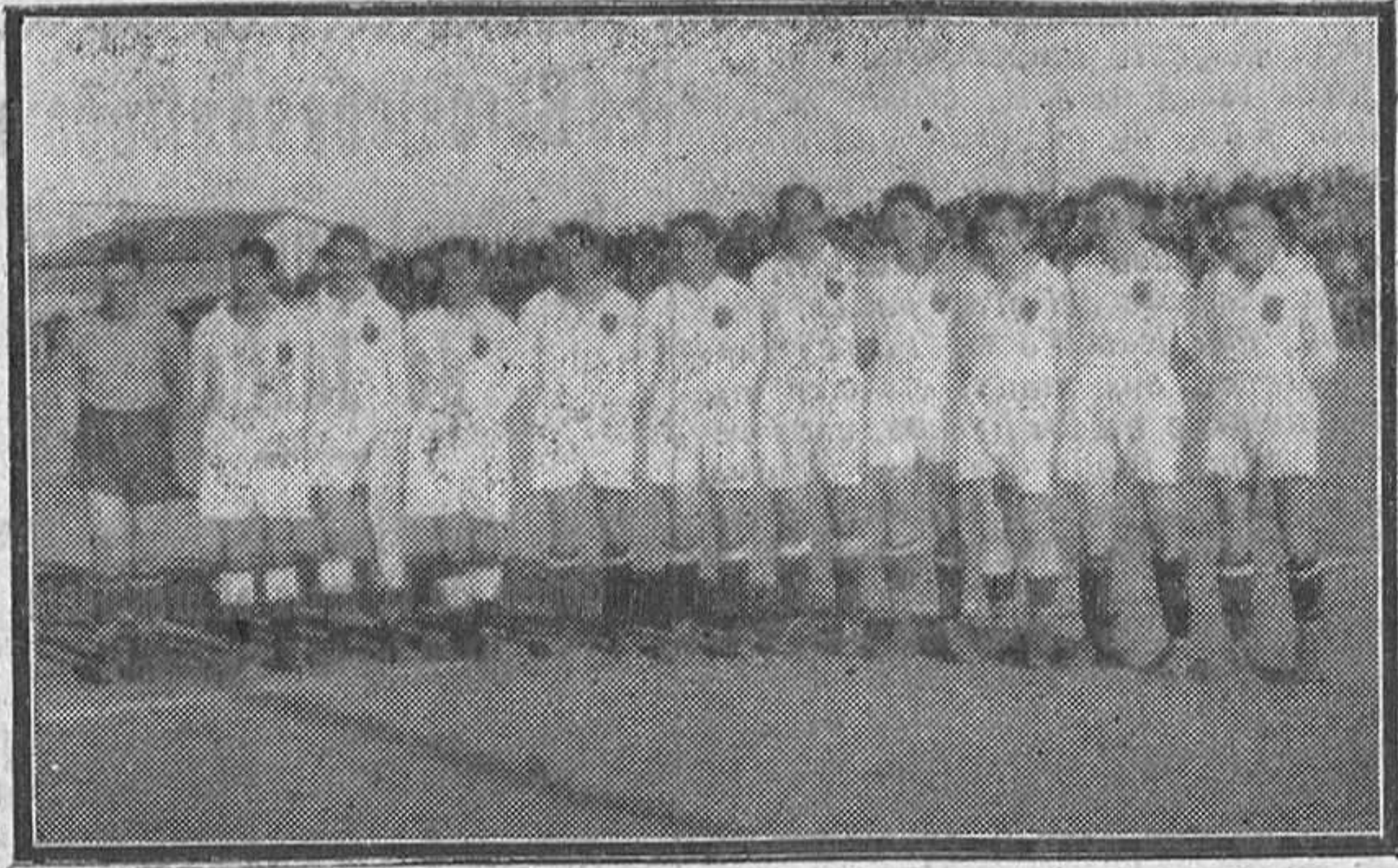
El equipo del Pontevedra, que fue derrotado en su presentación en Pantoja.

El respetable se metió con Deva, aunque sin mala intención. Tomando sus años y su mole física en el campo un poco a broma. Pero lo cierto es que el veterano jugador sigue con su potente pegada y que, aún abusando demasiado del juego