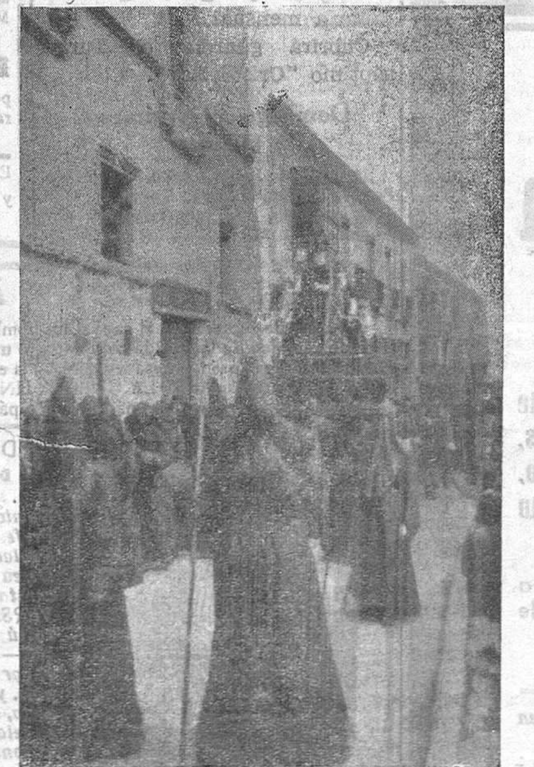
La Soledad regresa de las Tres Cruces

Las túnicas blancas, moradas y negras se turnan en los cortejos y un aire de penitencia abraza esos días la ciudad. Cada procesión tiene sus tradiciones y sus ceremonias, su orden y su jerarquía. Los Viernes Santos y en las plazas públicas la Madre se encuentra con el Hijo, medio vendido bajo el peso de la Cruz, y aún vencido, suficiente, el paso del Hijo se inclina reverente tres veces ante la Madre transida de dolor. Las acacias pequeñas de las plazuelas ofrecen a la Madre sus primeros racimos de flores y el Domingo de Pascua el Jesús Resucitado sale al encuentro de la Virgen. Cuando Hijo y Madre se saludan todo es alegría, júbilo de cohetes, tamboril y gaita. Y los esquilones chatos que en la catedral tocan a coro esperan ahelantes este día para ver cómo levantan sus faldas las hermosas campanas mayores de los campanarios de España.