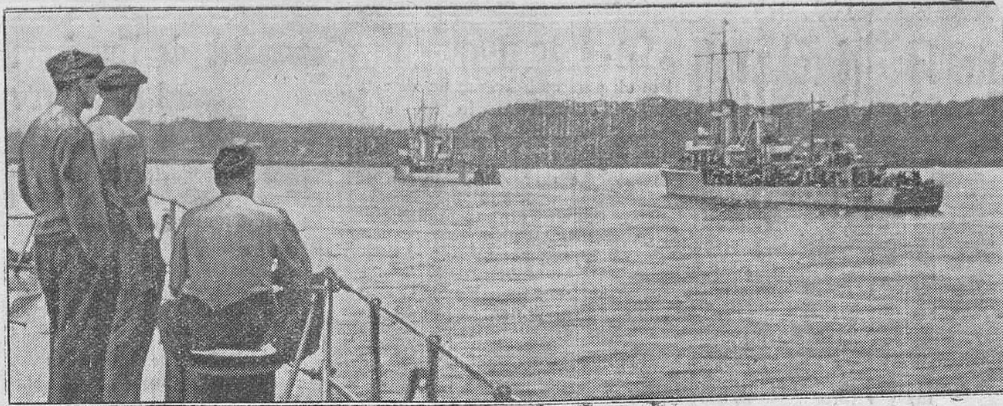
Destructores alemanes entran en un puerto de Francia después de actuar en la costa de Inglaterra

Las advertencias de los diputados en la Cámara de los Comunes, demuestran que las ideas de Churchill han llegado ya más lejos de lo que se pensó en un principio, pero también demuestran que Inglaterra se encuentra, con el próximo desastre, mucho antes de lo que se dejó entrever al exterior.