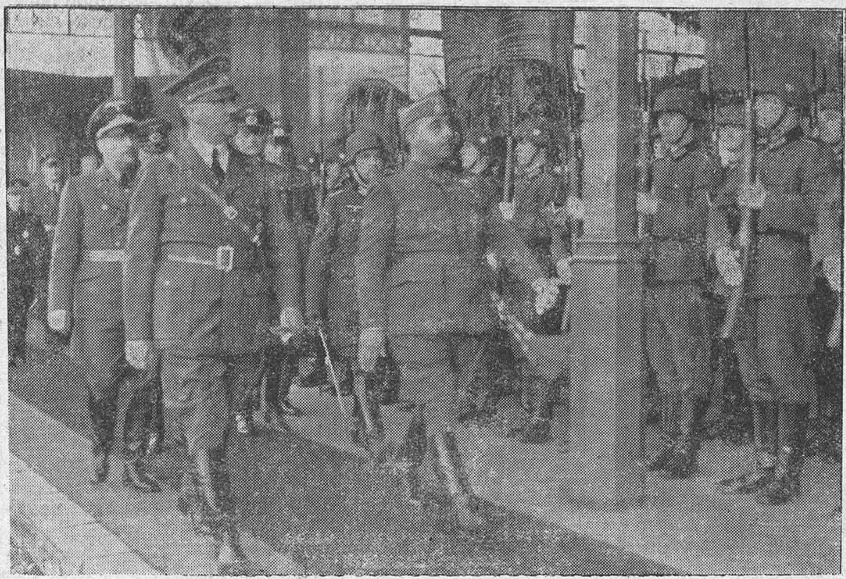
Los dos Jefes de Estado revistando el batallón que rindió honores