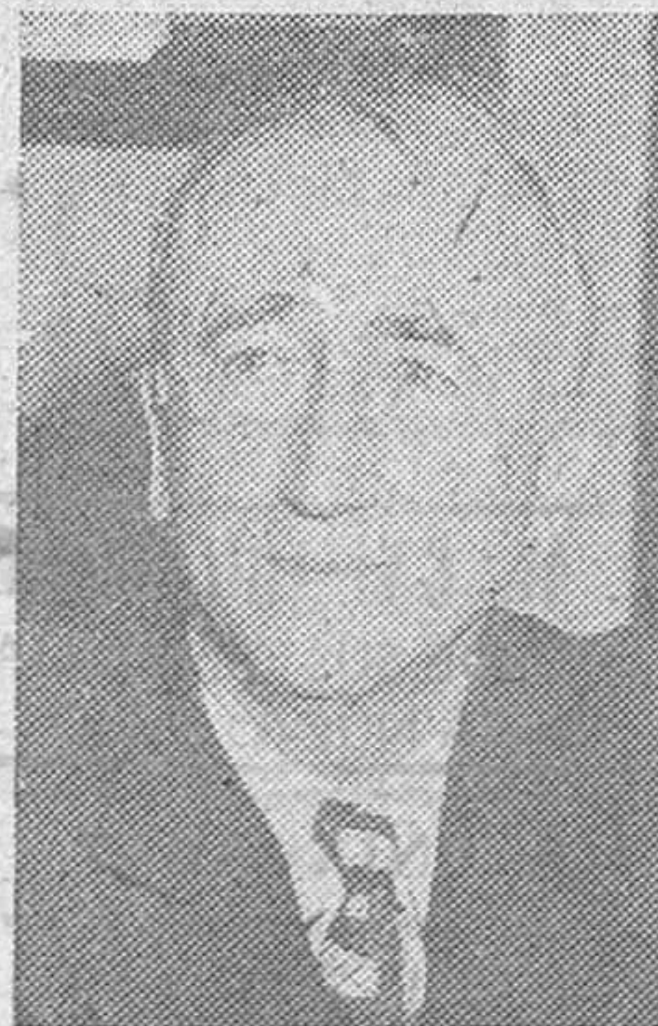
JAMES F. BYRNES