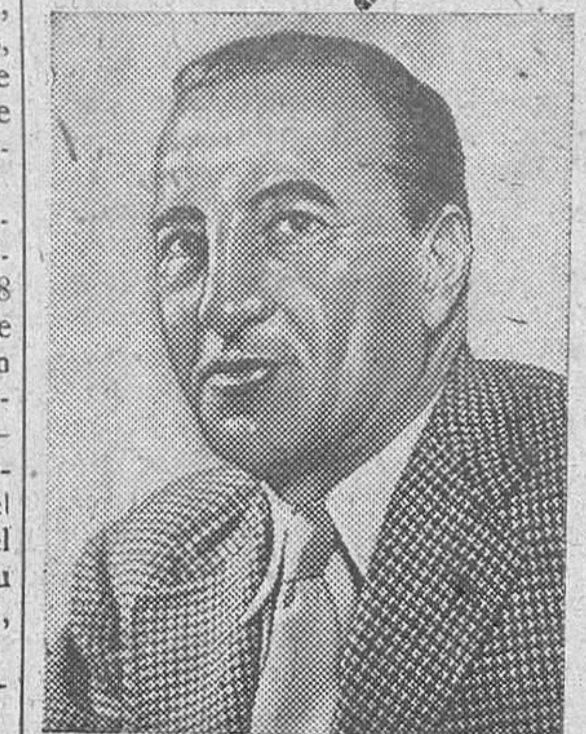
Sir Archibald Clark Kerr, lord Inverchapel, nuevo embajador de Inglaterra en Washington