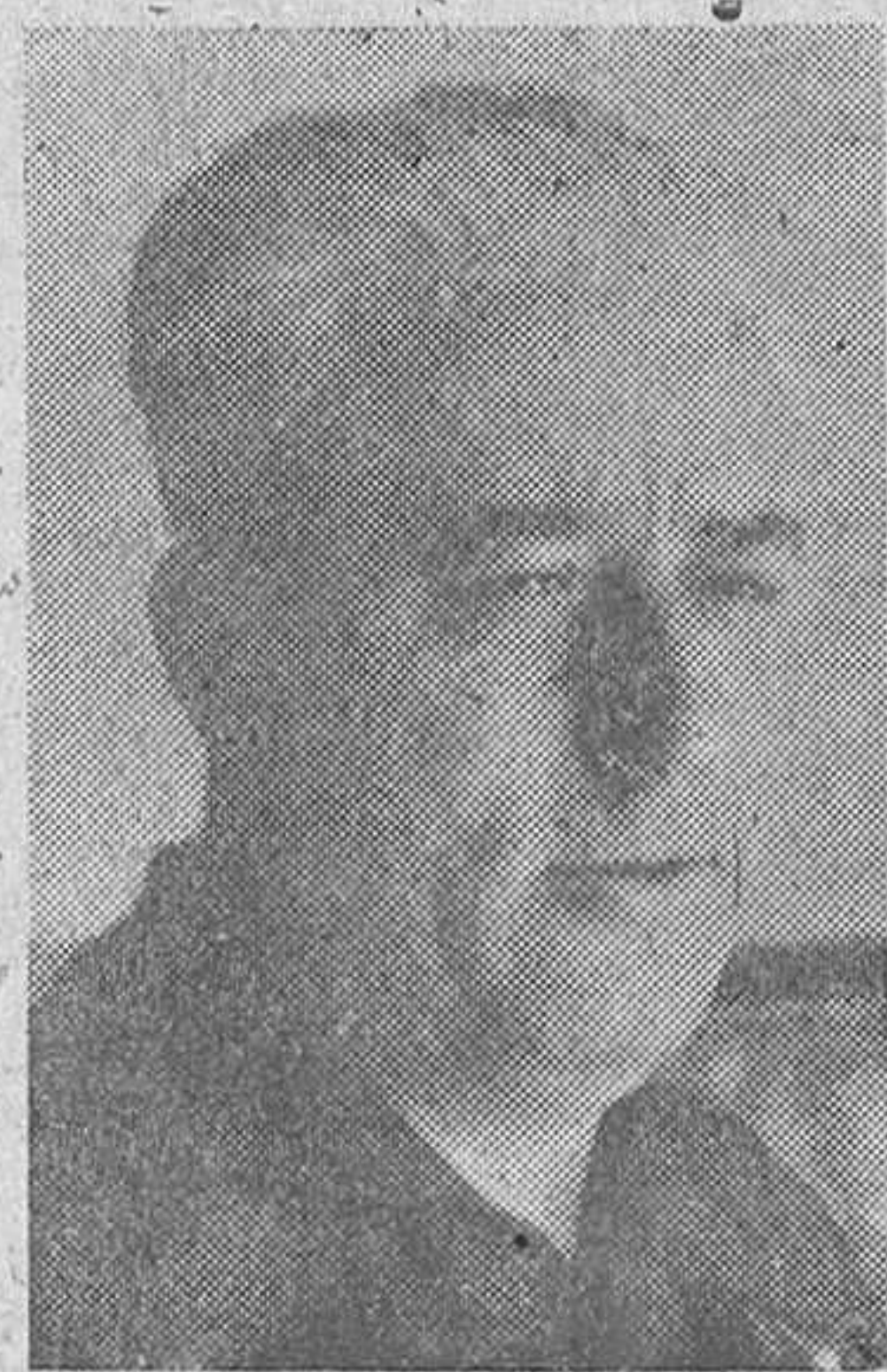
El teniente general Yagüe

Expedientes de obras de mejora y modernización de carreteras; de conservación, acondicionamiento, reparación o nueva construcción de las vías de