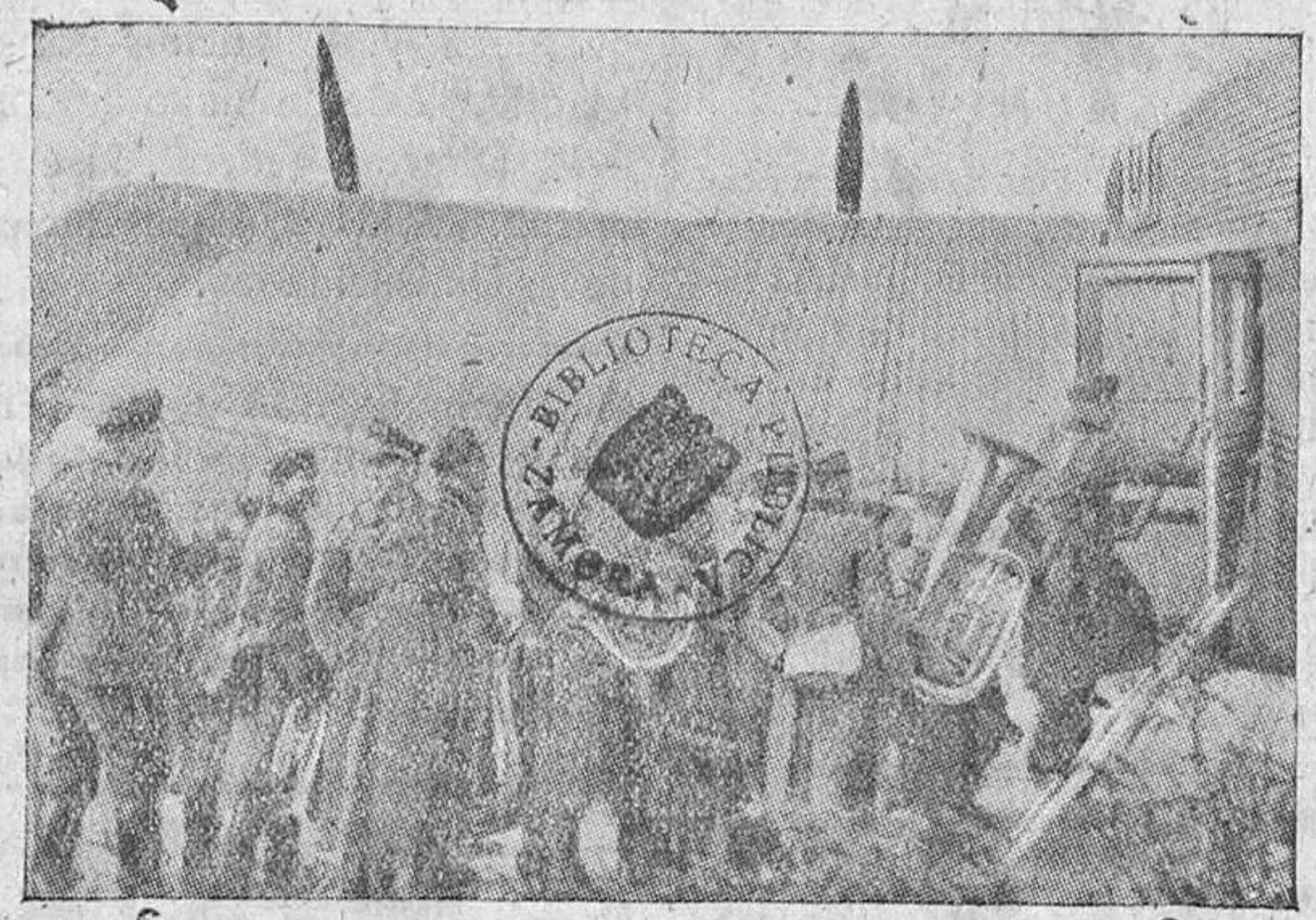
Músicos alemanes tomando el avión para, horas más tarde, divertir a los habitantes de Oslo

donde se manifestó el avance, progresan hacia el Norte, en dirección de Valais, en Calais. En toda la extensión de la línea de Somme el enemigo opone resistencia a nuestro empuje.