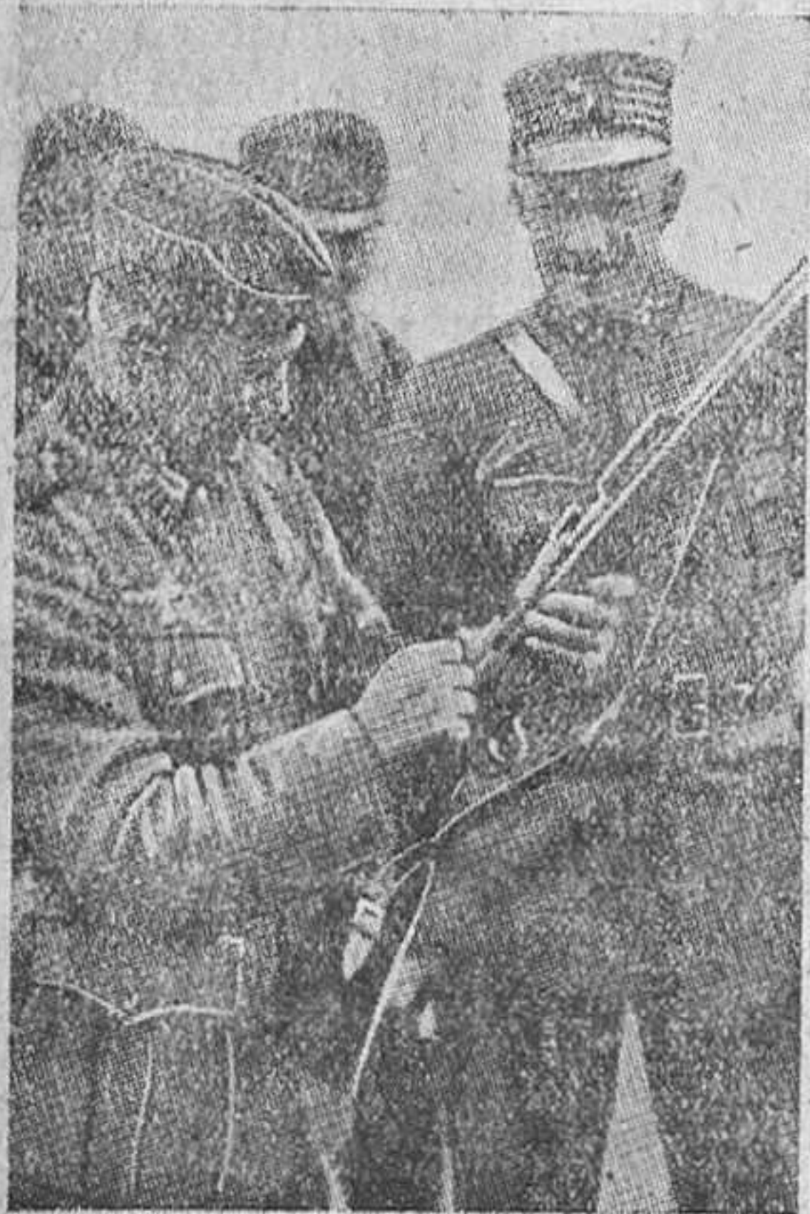
Soldado alemán explicando a otro noruego el mecanismo de su fusil