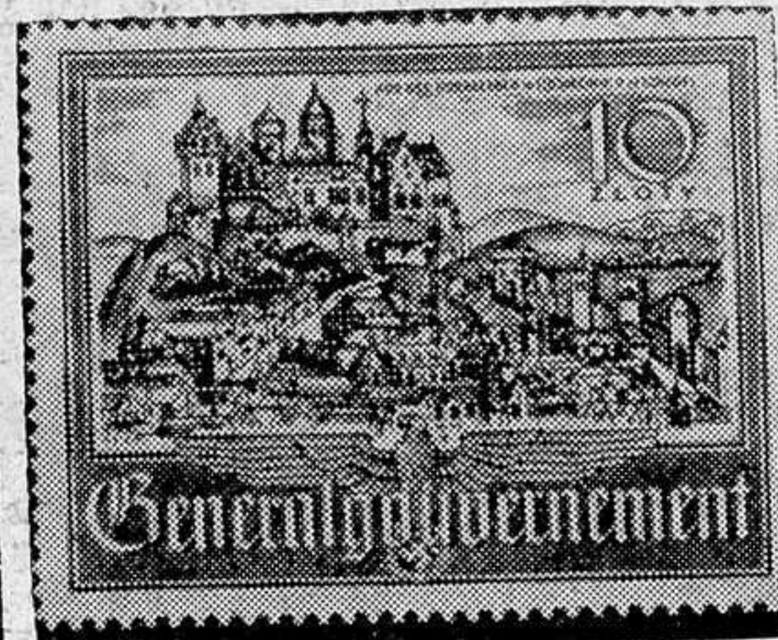
Sello del Gobierno General alemán del Este

«Nuestra artillería ha bombardeado intensamente el campo de aviación de Habbaniyah, ocasionando destrozos considerables en las instalaciones militares del mismo. La aviación irakesa ha realizado vuelos de reconocimiento. La policía ha ocupado la estación de radio inglesa de Samara, haciendo prisioneros al director de la misma y a cuatro funcionarios ingleses más. También fué bombardeado el campo de aterrizaje de Rachit, el pasado domingo, causando destrozos de importancia. Nuestras fuerzas han perdido diez hombres». — Efe.