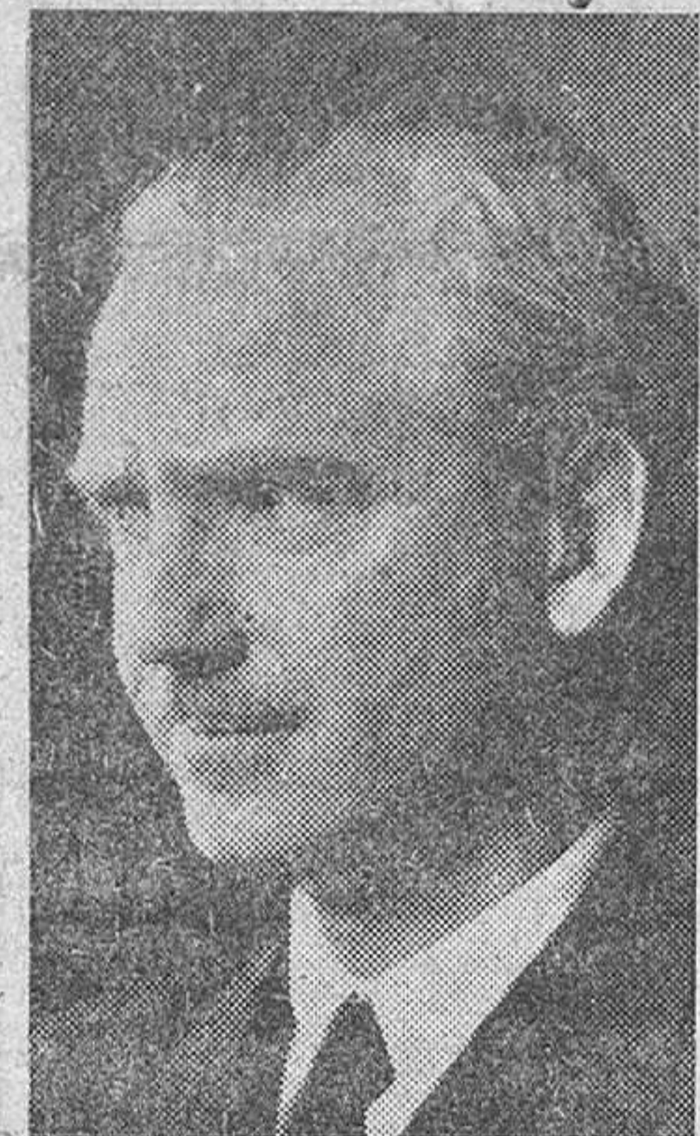
RAMON SERRANO SUÑER Presidente de la Junta Política, Vicepresidente del Consejo Nacional

la mañana empezaron a llegar al Monasterio de las Huelgas, donde se celebró el acto, los Consejeros, haciéndolo en primer lugar la Delegada Nacional de la Sección Femenina Pilar Primo de Rivera.