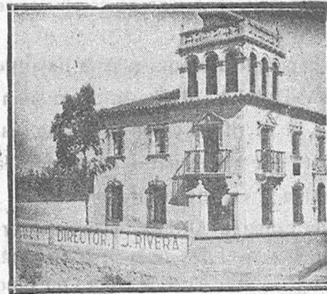
Avenida de San Pablo, núm 1.