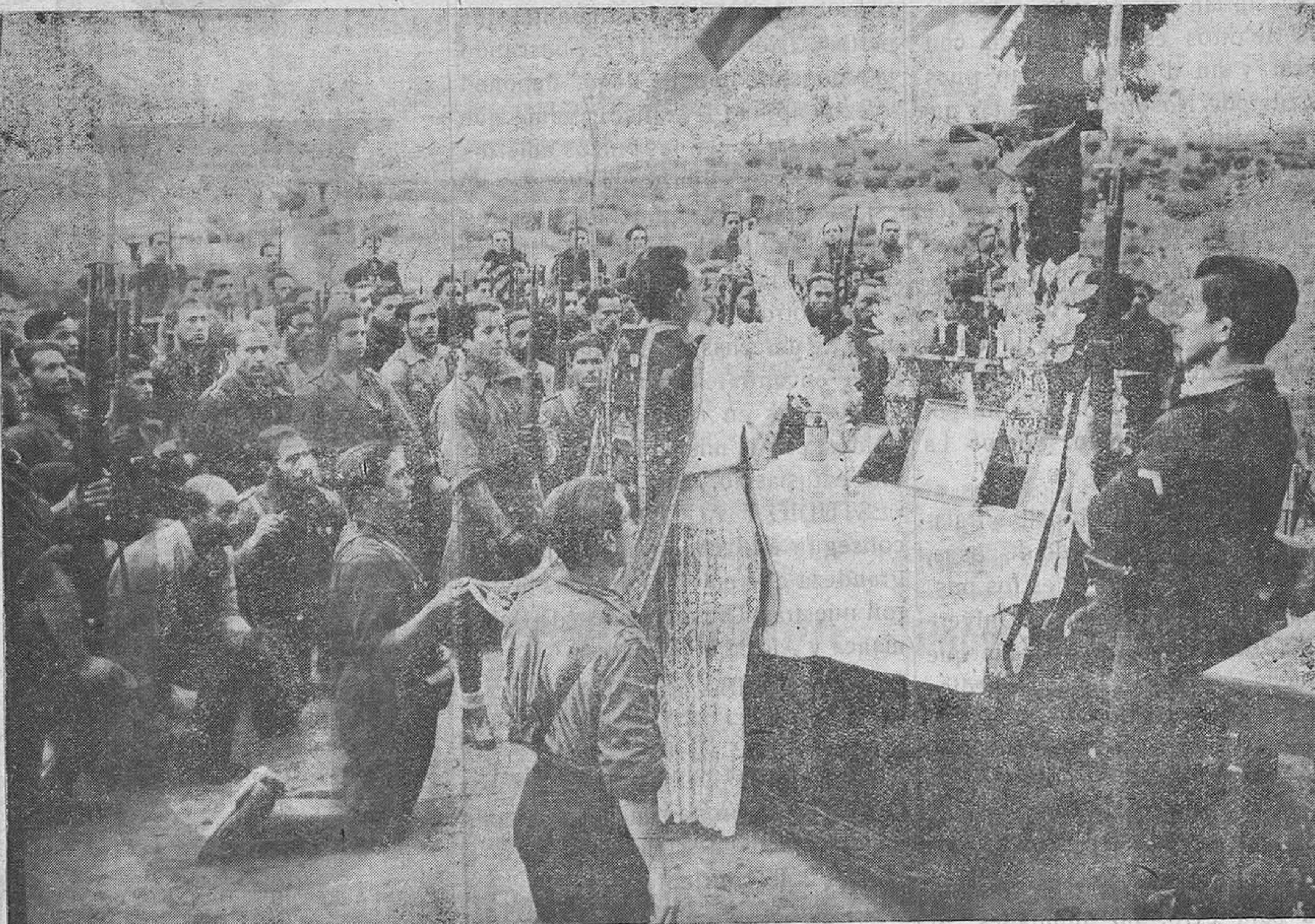
La Centuria “Imperio” oyendo Misa de Campaña

Nuestras obras hoy, van a tener como eje el tercer precepto del Decálogo. Ya está todo preparado; pero nos falta casi lo esencial; carecemos de ornamentos sagrados: desde nuestros parapetos divisamos en el mismo campo enemigo, una iglesia, que ostentaba las huellas de barbarie, que