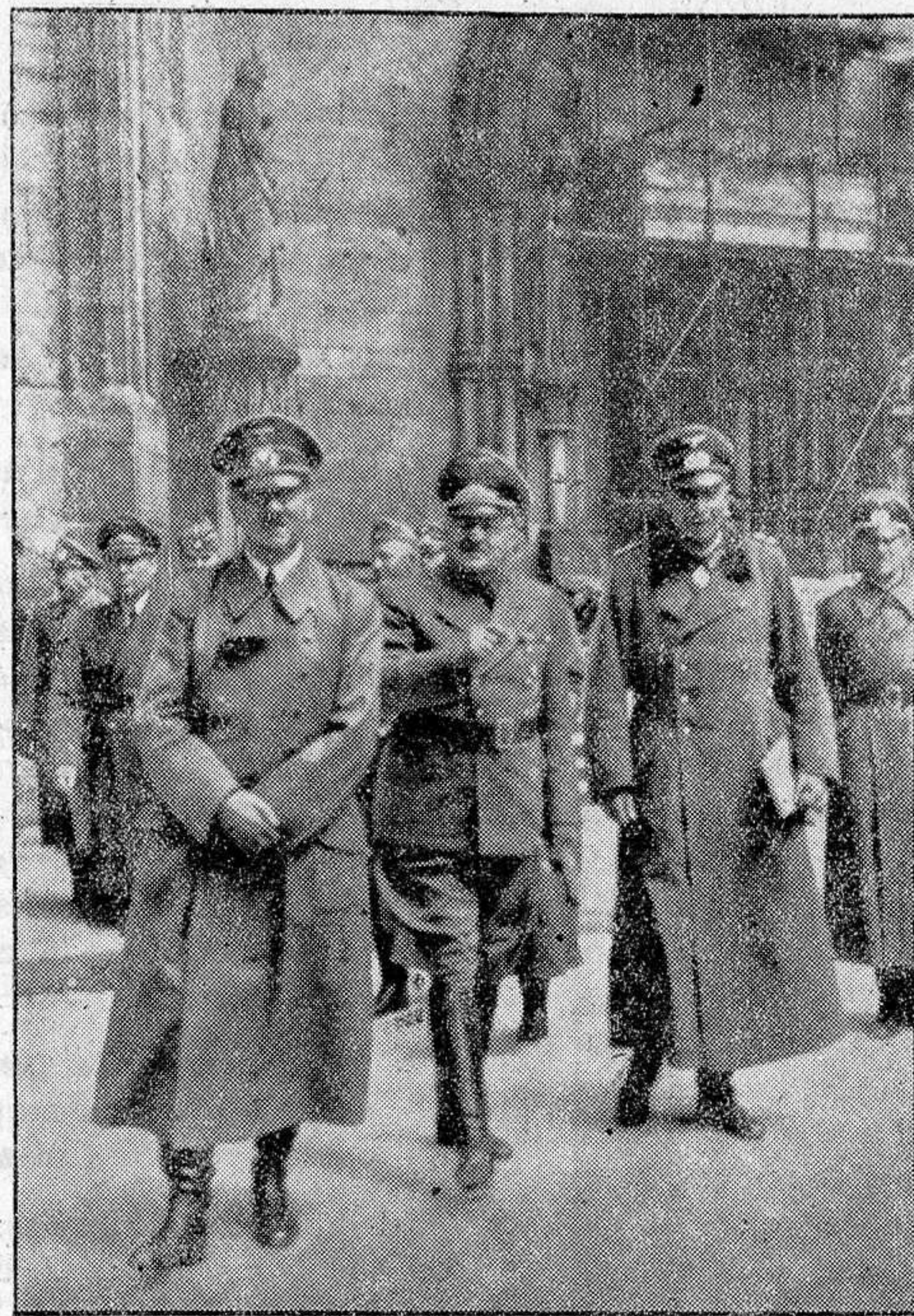
El Führer Canciller después de visitar la Catedral de Strasburg

Varios aviones enemigos volaron sobre Holanda y el Norte de Francia impidiéndose su actuación, merced a la eficaz defensa de los cazas y las baterías de la DCA. Las bombas fueron lanzadas al azar. En el curso de estos combates aéreos, fueron derribados dos aviones «Bristol». Otro aparato del mismo tipo fué derribado por la artillería antiaérea sobre los alrededores del Havre. Los aviones ingleses que volaron sobre el Norte y Oeste del Reich en la noche del 2 de agosto, dejaron caer sus bombas sobre diversos lugares que carecían de objetivo militar, destruyendo casas habitadas y matando e hiriendo a las personas que la habitaban. En la ciudad de Hers una granja fué alcanzada por una bomba y destruída. Cuatro miembros de la familia labradora que la ocupaban, entre ellos dos niños: de uno y dos años, resultaron muertos y otras personas gravemente heridas».—Efe.