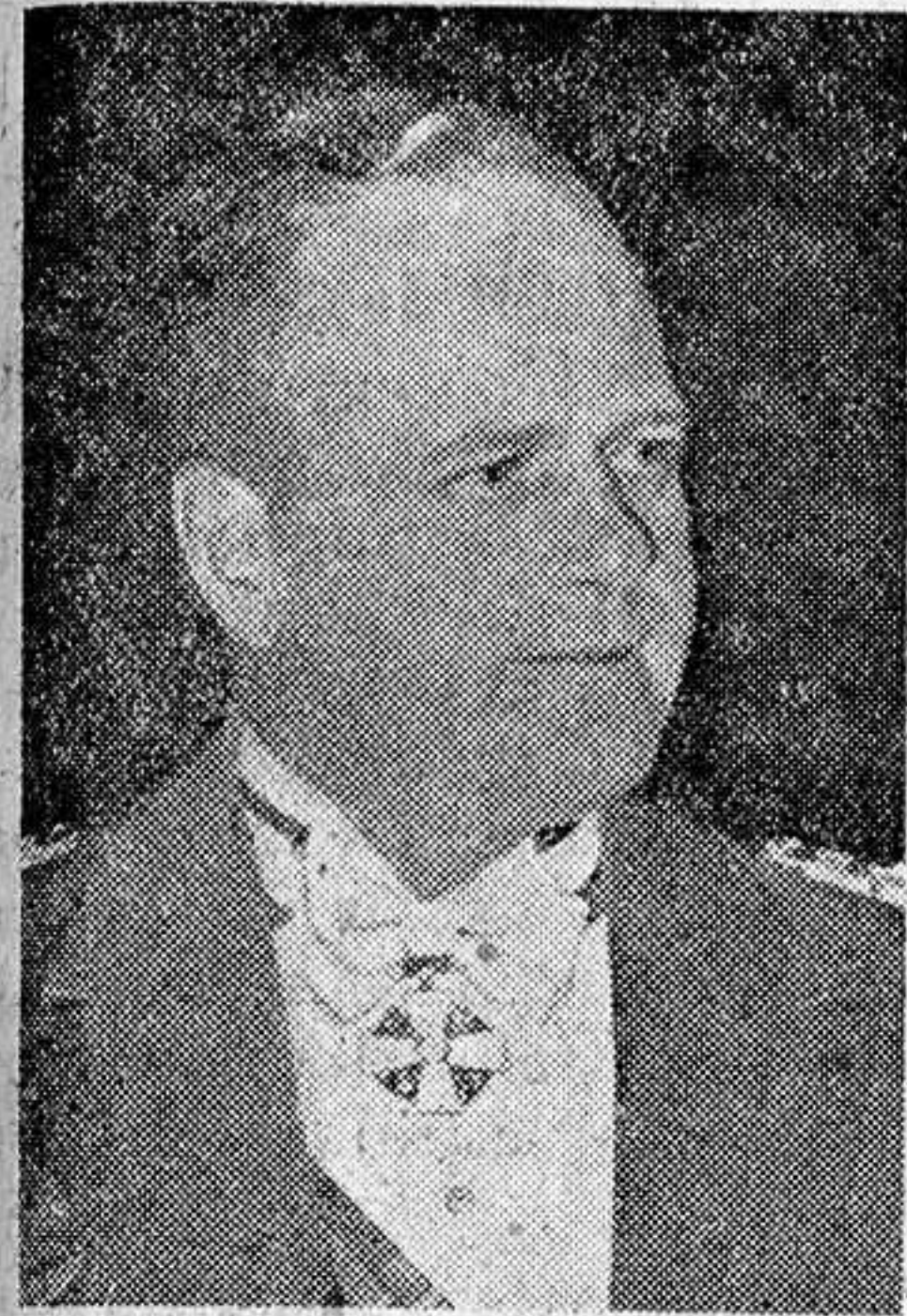
General Milch, ascendido a Mariscal de Campo