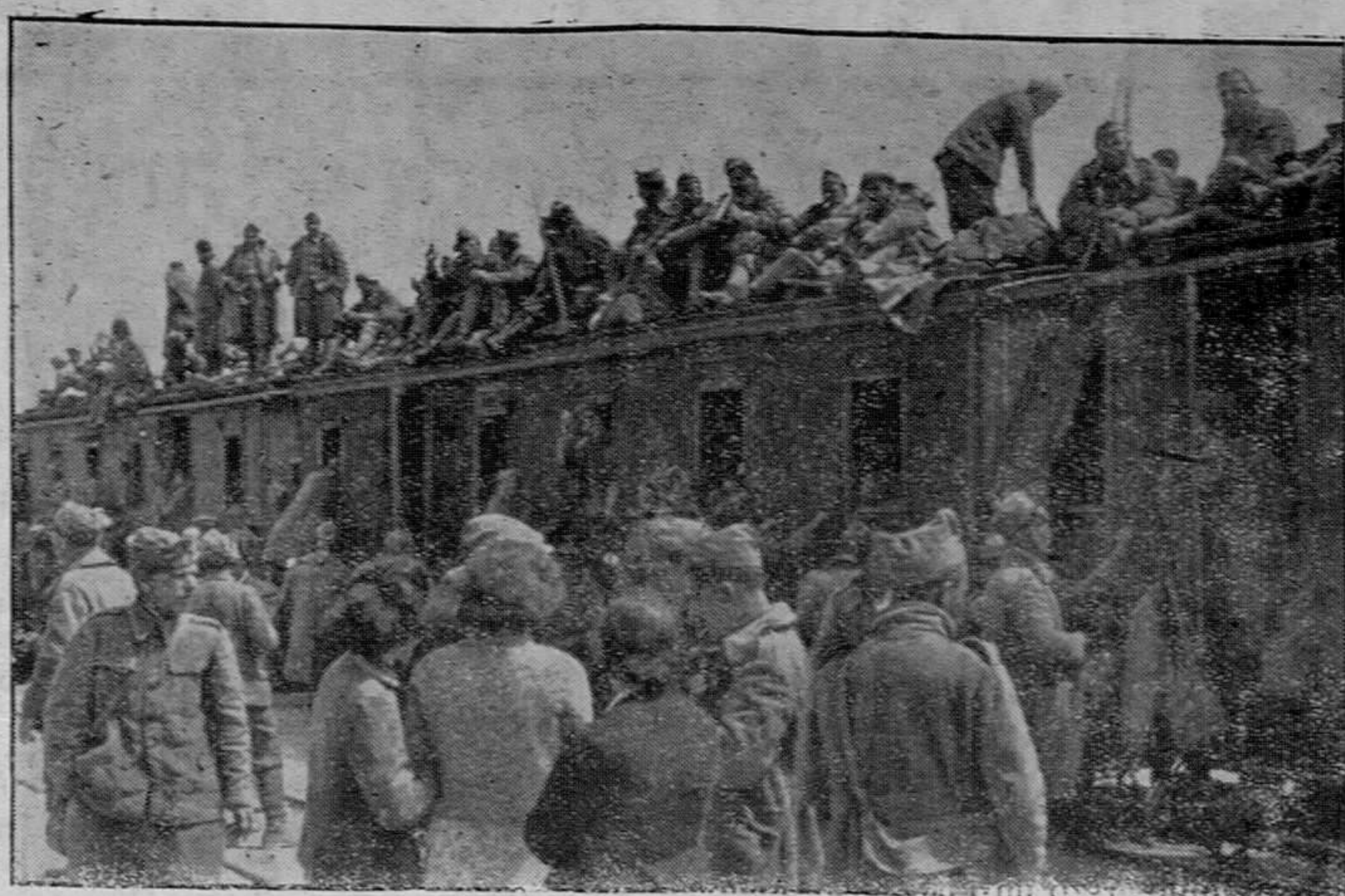
Los prisioneros griegos, por el magnánimo decreto del Führer han sido puestos en libertad. El aspecto de la foto de prisioneros griegos que regresan a sus hogares ha durado muchos días por los ferrocarriles y carreteras griegas.