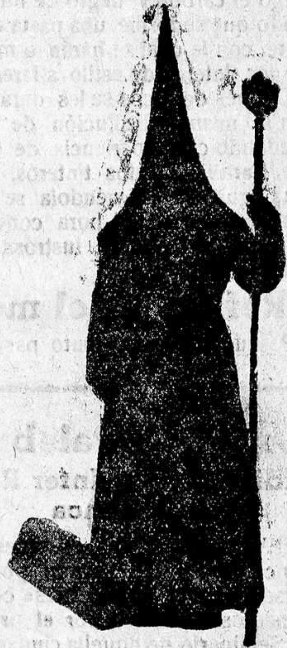
Cofrade del Santo Entierro

Los hermanos de esta Cofradía, visten túnica negra y llevan vara, unos con Cruz y los mayordomos con la insignia de la Institución. Sale a la hora indicada de citado templo de San Esteban, y abre la marcha un piquete de la Guardia Civil, montada sigue el "Barandales" y las Cruces de todas las parroquias y concurren los alumnos del Seminario, exhibiéndose en ella los grupos escultóricos "La Magdalena", "Longinos", El Santísimo Cristo de las Injurias, que es reintegrado a su capilla de la Catedral, "El Descendimiento", "El Descendimiento", "La Conducción al Sepulcro", "El Santo Sepulcro" y la Virgen de los Clavos. Son todos ellos de gran valor artístico y se exhiben con verdadero lujo.