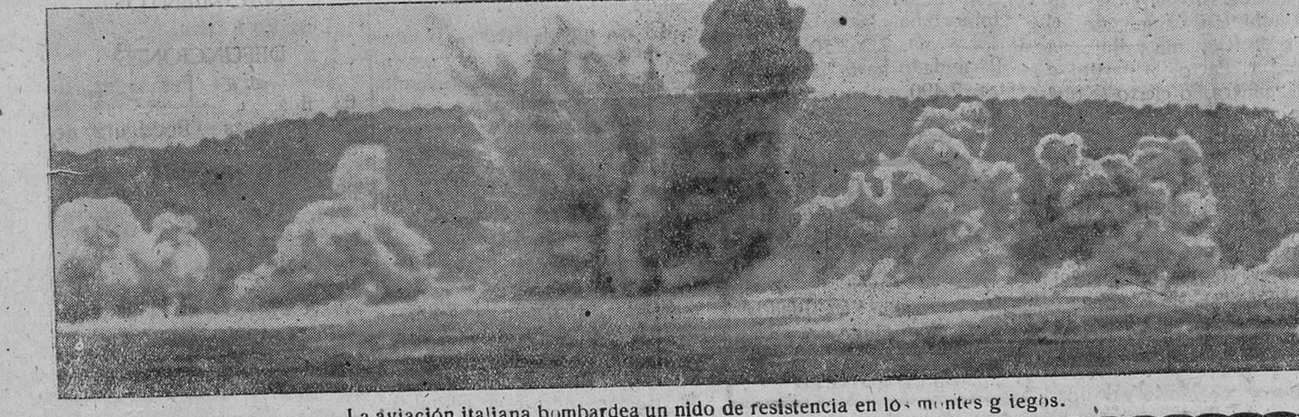
La aviación italiana bombardea un nido de resistencia en los montes pegios.

Comunicado alemán. Berlín.—Nuestros submarinos que operan en el Atlántico Norte hundieron 27.500 toneladas de mercaderes, entre ellos un petrolero. Las fuerzas aéreas actuaron con gran éxito contra la navegación británica en el mar del Norte Atlántico y Mediterráneo.