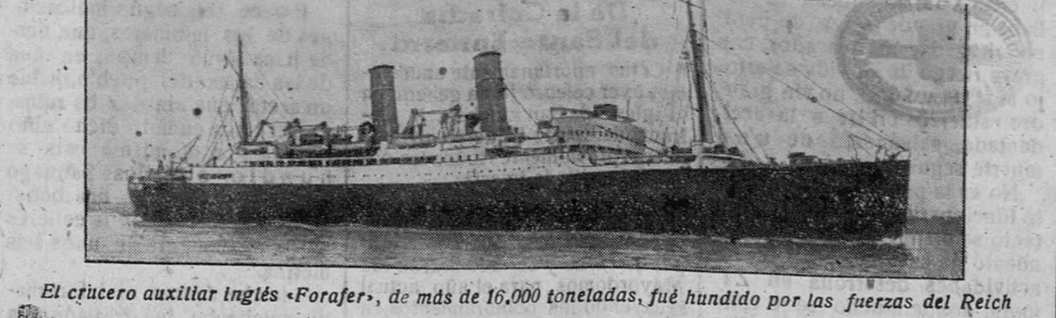
El crucero auxiliar inglés «Fofar», de más de 16.000 toneladas, fué hundido por las fuerzas del Reich