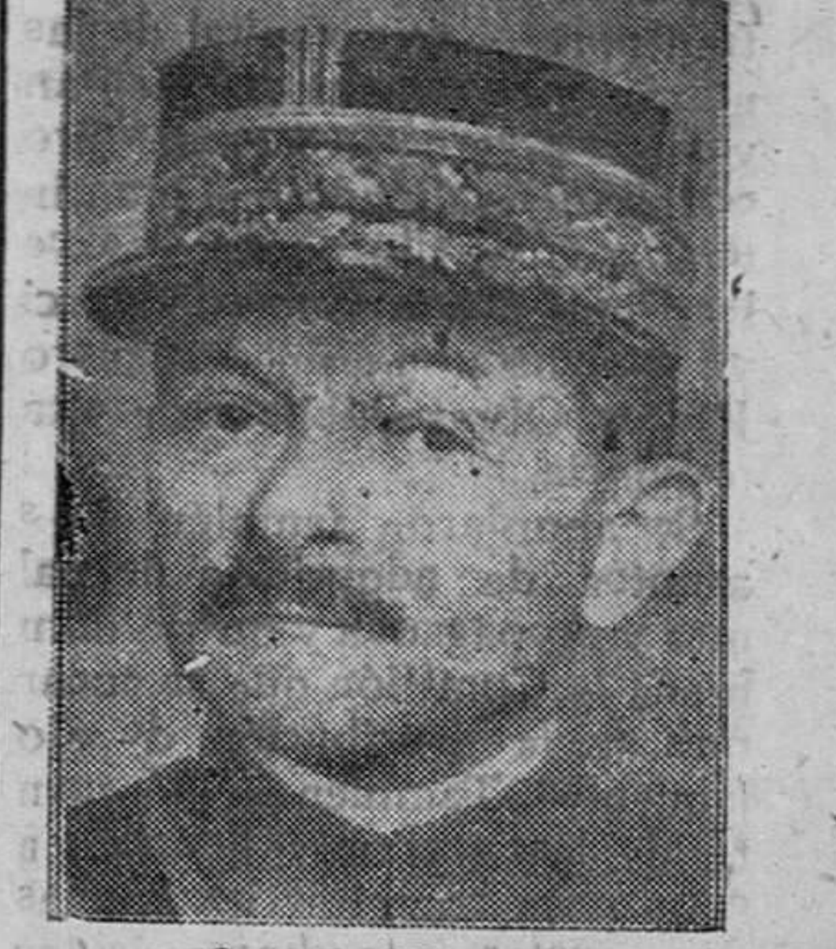
General Weygand fender el imperio colonial francés contra cualquier ataque.

Nueva York.—El general Weygand ha declarado al corresponsal de la United Press en Argel que el Africa francesa está con el mariscal Pétain, que, por su parte, está firmemente decidido a de-