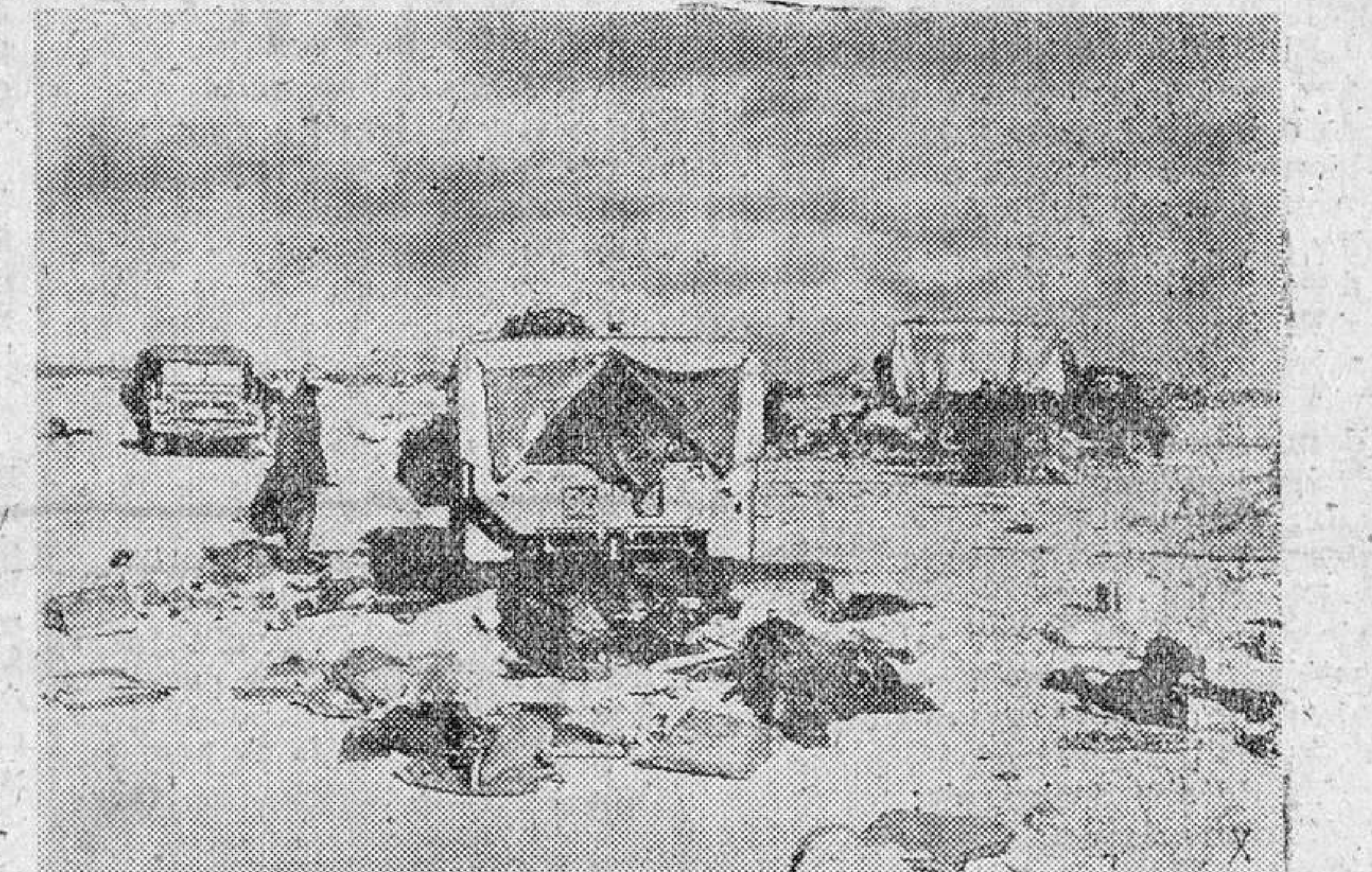
Huellas de una batalla en el frente libico.

Estado a que fué reducida una columna motorizada inglesa que intentó un ataque a las formaciones blindadas del Eje.