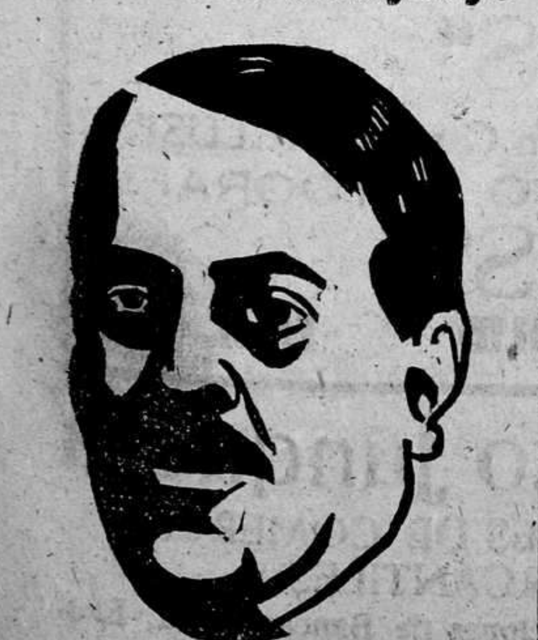
Figura señera del Ejército, alma templada en la lucha y en el sacrificio, que después de ofrendar a España su vida en reiteración generosa, nos legó, con su muerte, el ejemplo incomparable de una conciencia encandorada siempre en el estrecho camino del deber y de la abnegación.