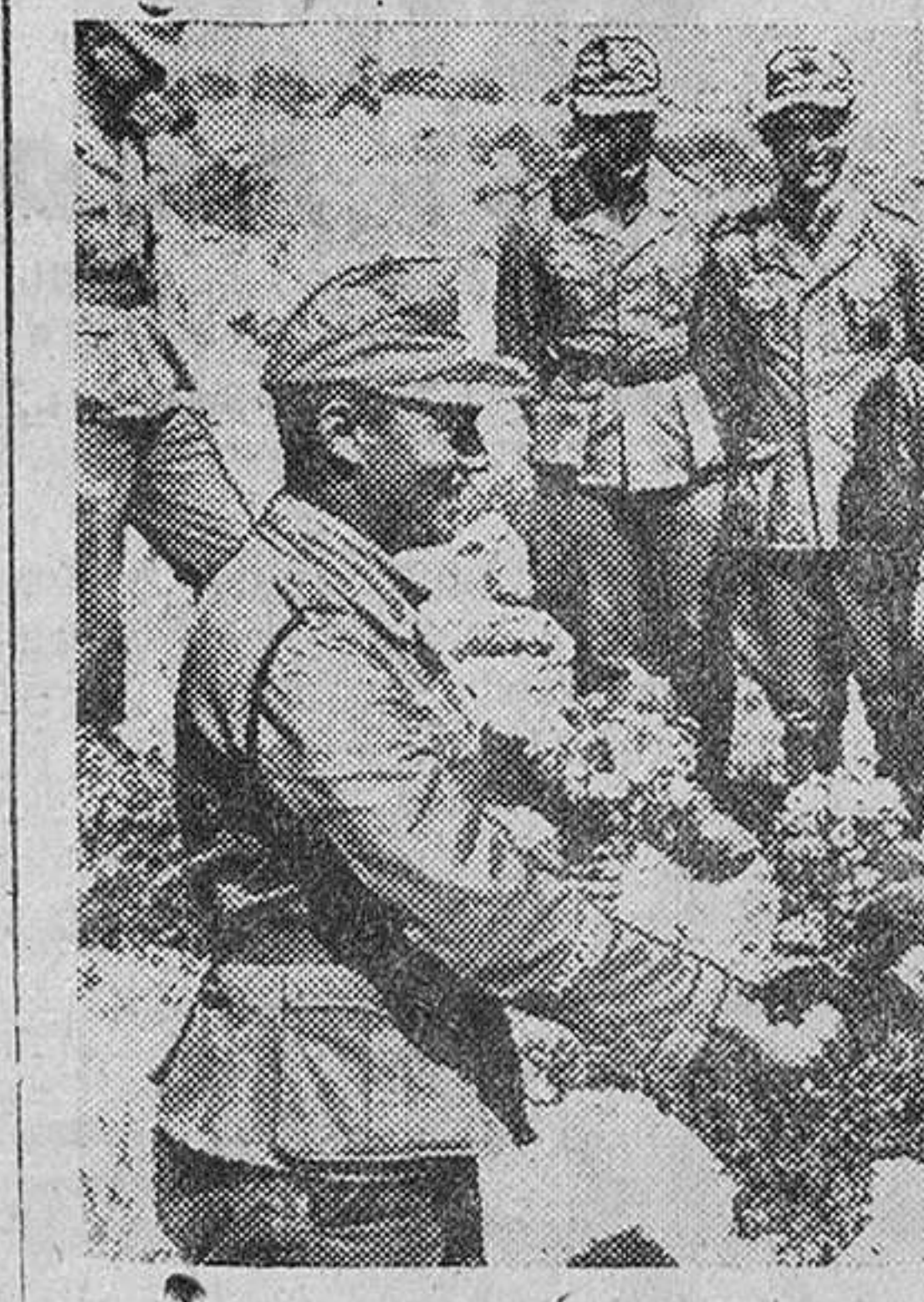
Matrimonio por poderes Un combatiente alemán del Cuorpo africano es obsequiado por sus camaradas con ramos de flores después de la ceremonia del matrimonio ante el jefe de su unidad. La novia habrá comparecido a la misma hora, ante las autoridades competentes de un lugar de Alemania.

OTROS TRES MERCANTES MAS HUNDIDOS Washington.—Tres buques mercantes, uno británico, de tonelaje medio, otro griego de pequeño desplazamiento y un pesquero norteamericano han sido hundidos por los submarinos del