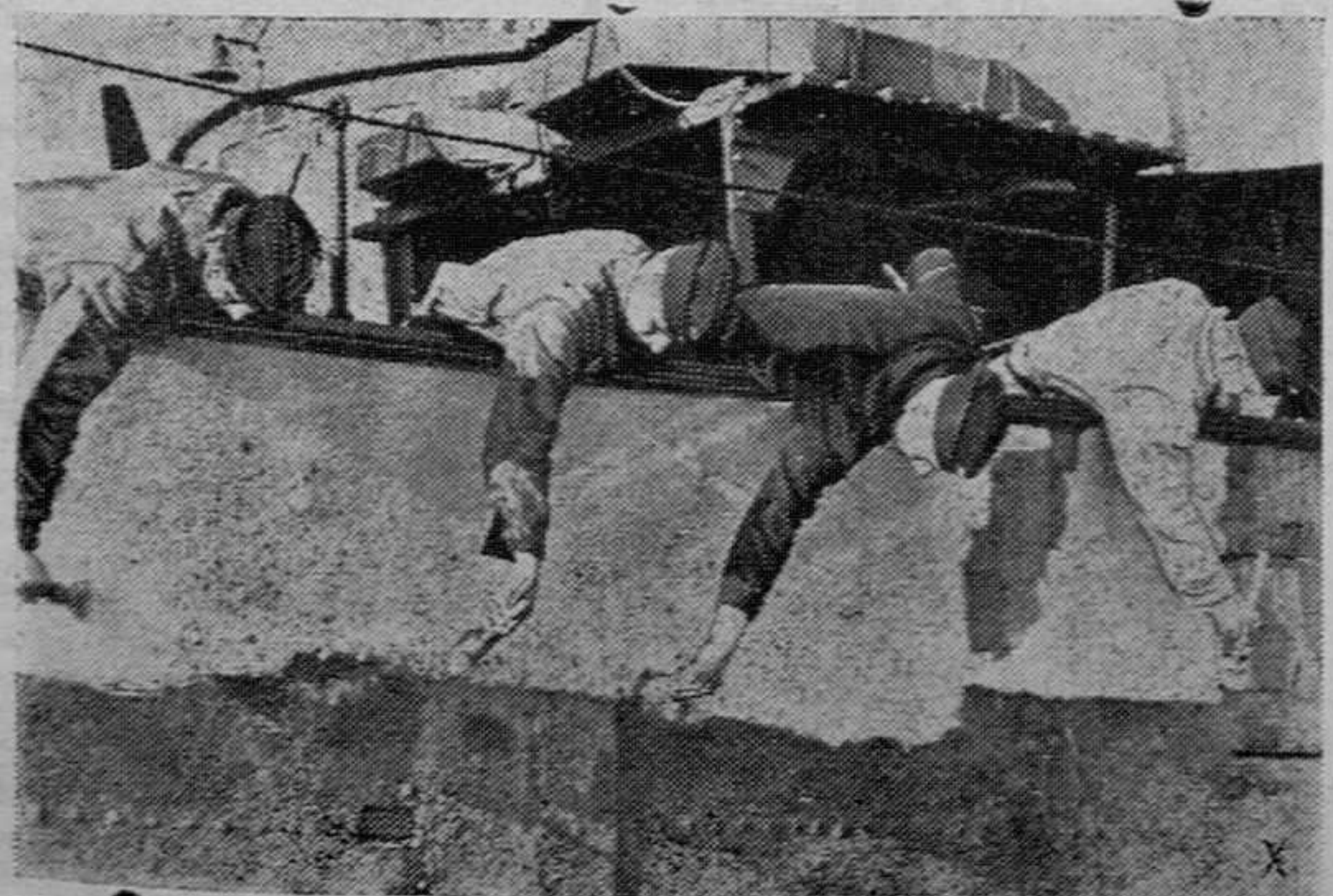
El eterno trabajo de los marinos

Ciudad del Vaticano.—La primera india norteamericana va a ser elevada a la gloria del altar. El día 9 de Junio se reunirá la Congregación de Ritos, en presencia del Papa, para reconocer las virtudes de la bienaventurada «piel roja», llamada Catalina Teakwika.—Efe.