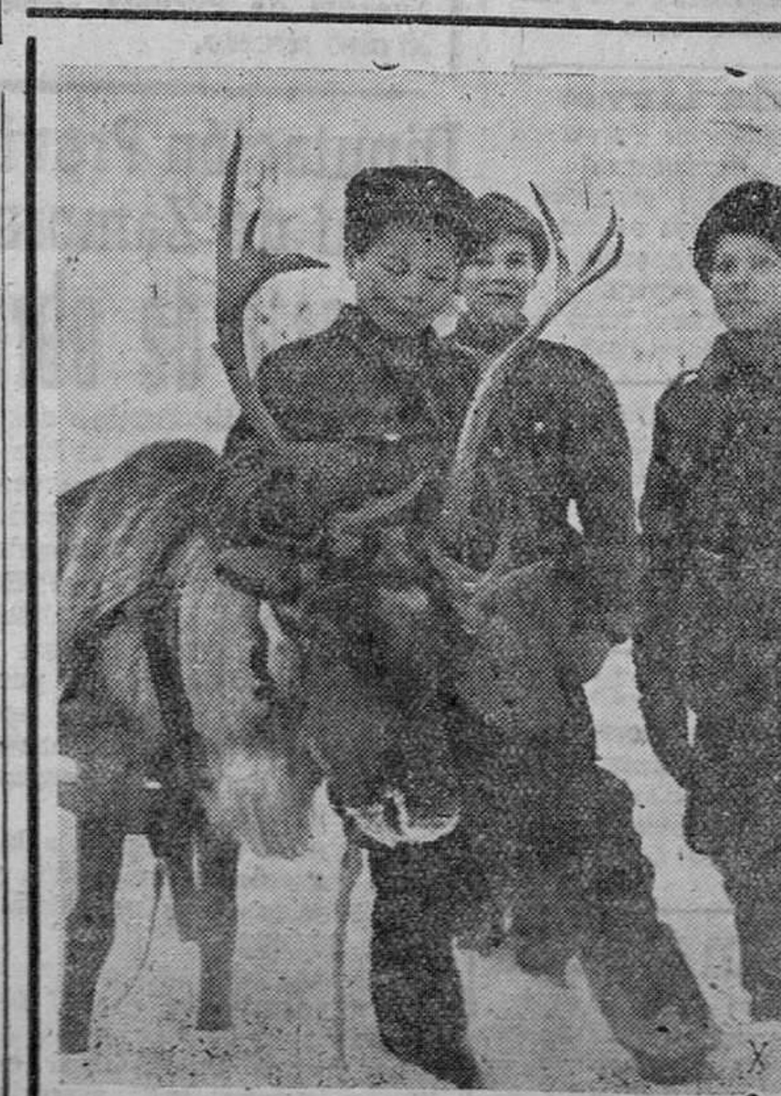
El reno es indispensable en el frente de Laponia para el tiro de la polka, trineo de los habitantes de estas regiones, y que los alemanes han usado mucho durante todo el invierno. He aquí unos jóvenes naturales junto al reno de un trineo que conduce el correo a una posición avanzada.

Pagad oportunamente las cuotas necesarias en el Instituto Nacional de Previsión para que las obreras-madres reciban a tiempo los beneficios del Seguro.