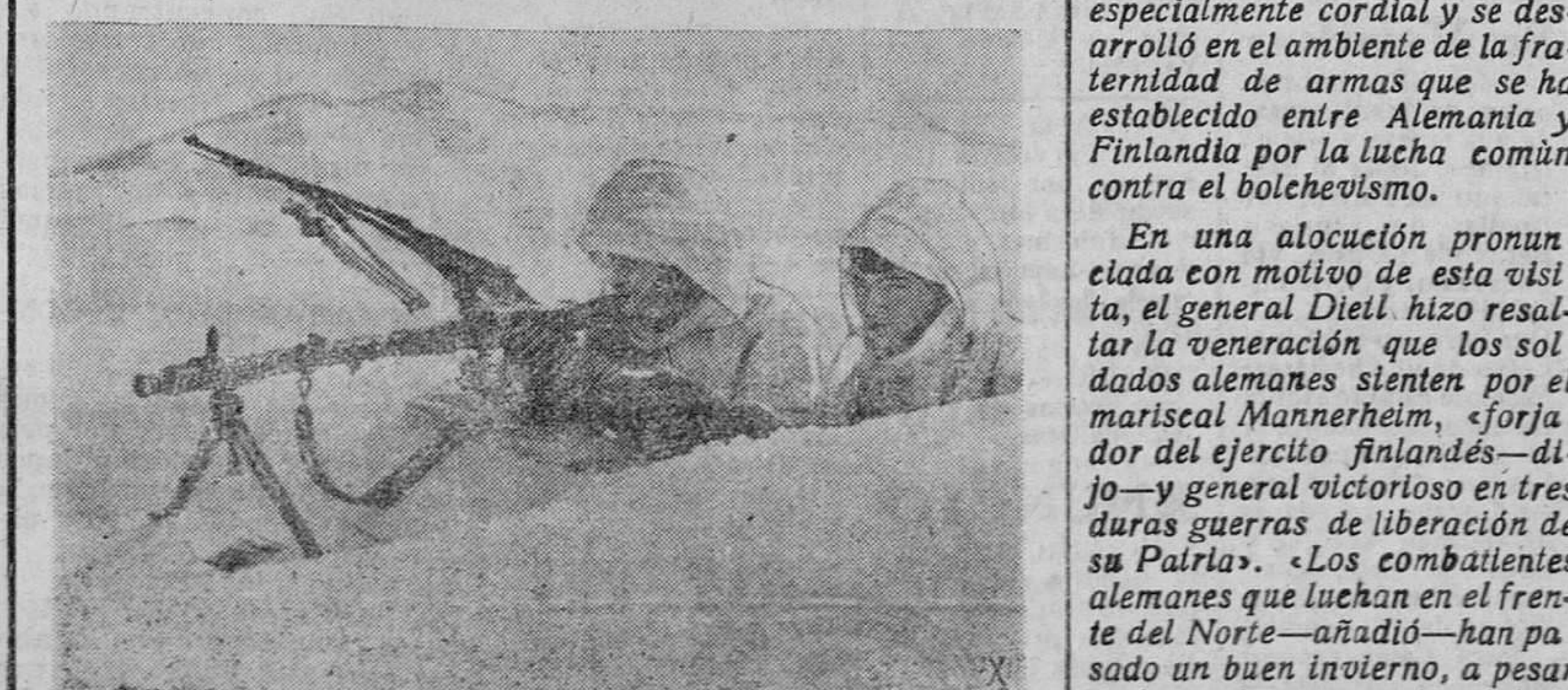
La guardia en el frente del Este. Puesto alemán de ametralladora delante de un pueblo en el distrito de Moscú

En una alocución pronunciada con motivo de esta visita, el general Dielt hizo resaltar la veneración que los soldados alemanes sienten por el mariscal Mannerheim, «forjador del ejército finlandés—dijo—y general victorioso en tres duras guerras de liberación de su Patria». «Los combatientes alemanes que luchan en el frente del Norte—añadió—han pasado un buen invierno, a pesar de la crudeza excepcional de la temperatura, y han vencido todas las dificultades que se presentaron a su labor. Estos soldados entienden que combaten por la defensa de Finlandia defienten igualmente su propio suelo. Por eso están convencidos de que este año será el del triunfo final sobre el enemigo soviético, triunfo que se conseguirá en íntima y fraternal colaboración con el magnífico ejército finlandés».