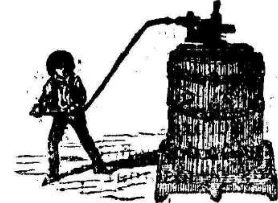
Pre a a.

Máquinas de vapor, Bombas, Prensas, Tubos de todas clases, Aparatos para hacer gaseosas, y toda clase de máquinas.