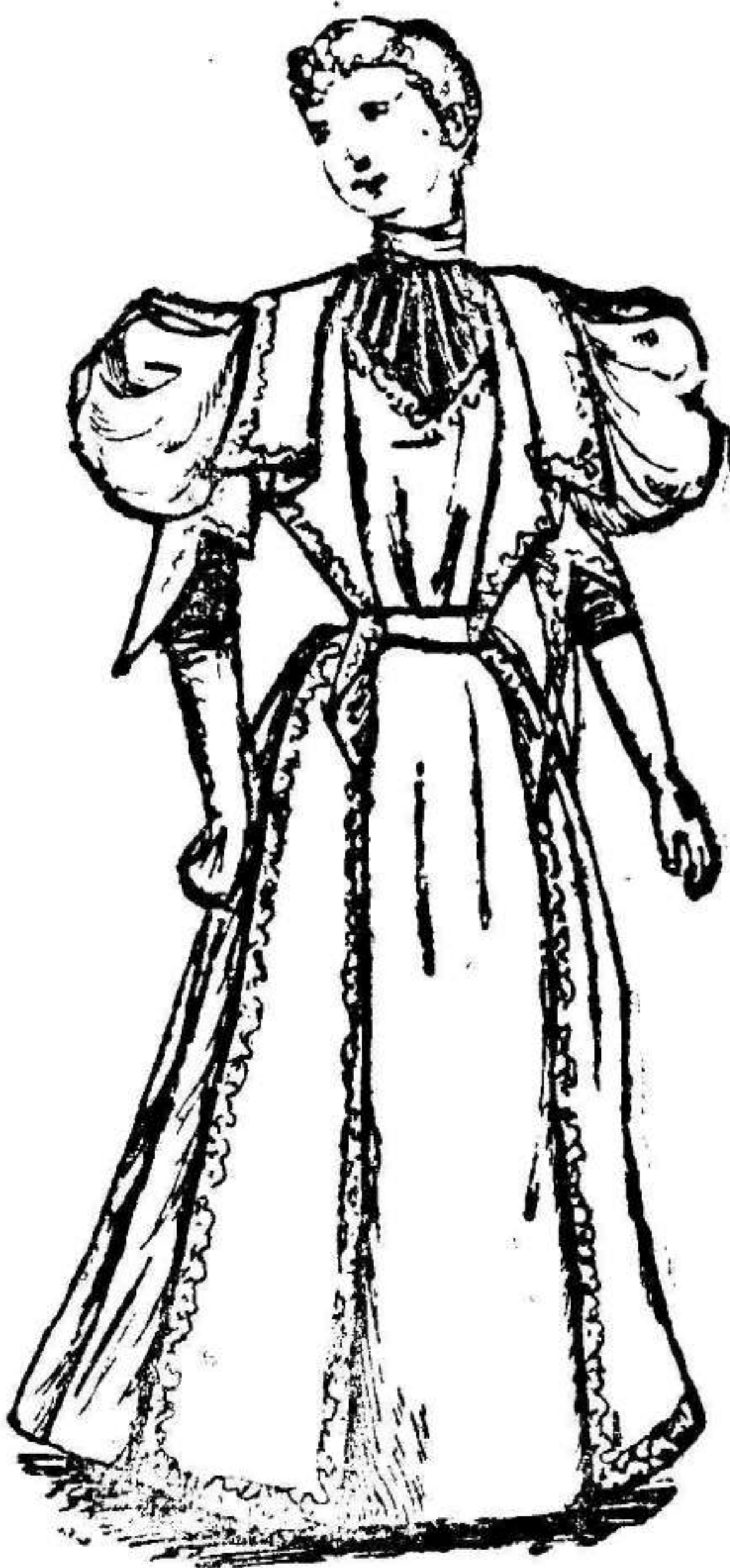
TRAJE DE COMIDA PARA SEÑORITA.

Es de surah verde Nilo, adornado de terciopelo cardenal y galones fantasía. Cuerpo fruncido y abierto por delante en forma de pico dejando ver una camiseta de terciopelo. El talle es rodeado por un cinturón de galón fantasía. Cuello imperio formando un pico en la espalda y otro en cada hombro, terminando en coquillé sobre la falda. Manga drapeada con graciosos picos imitando el cuello y dejando ver un pequeño puño de terciopelo cardenal rematando el cuello imperio; mangas y demás con galón fantasía.