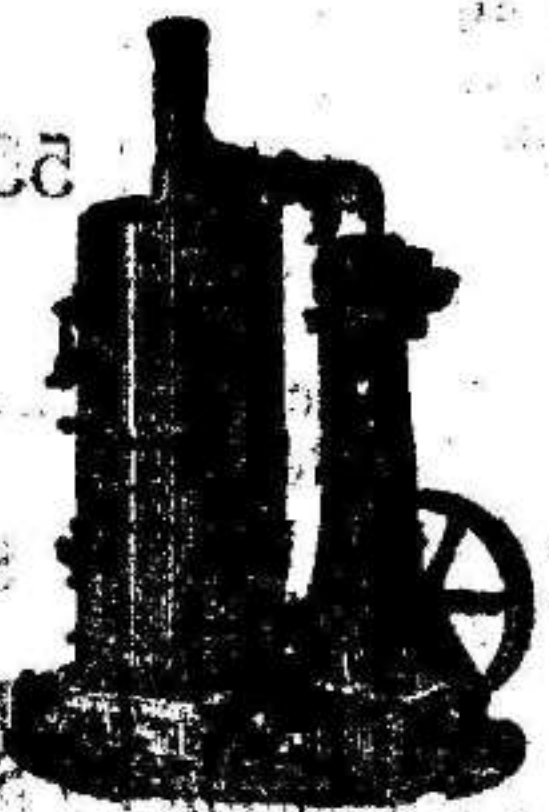
Maquina de vapor vertical