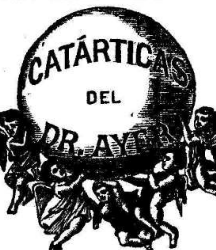
Para el tratamiento y rápida curación de las

Enfermedades del estómago y de los intestinos, padecimientos del Hígado, dispepsia, indigestiones, cólicos, náuseas, diarrea, presión de vientre, falta de apetito, incomodidad después de la comida, jaquecas y dolores de cabeza crónicos, reumatismos y nevralgias, enfermedades de la piel, molestias periódicas de las señoras, y ademas de estas, muchas otras enfermedades que se clasifican bajo una infinidad de nombres, pero que todas provienen de la misma causa, á saber: Desarreglos de los Organos de la Digestion y Asimilacion , cuyos desórdenes son la causa de la impureza y pobreza de la sangre, comunicando, de este modo, debilidad y congestión á todos los órganos vitales del sistema.