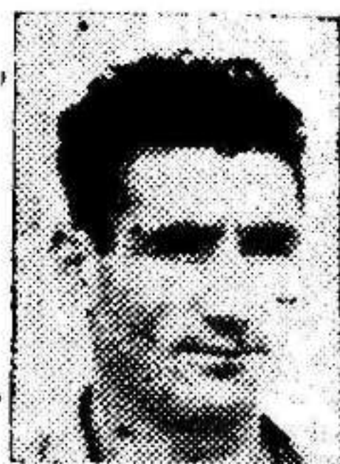
Astobiza, que ayer debutó en las filas granas

FABRICA DE CARAMELOS DE BLAS GARCIA Pastillas de café y leche Floridablanca, 54 Tel. 1464 MURCIA