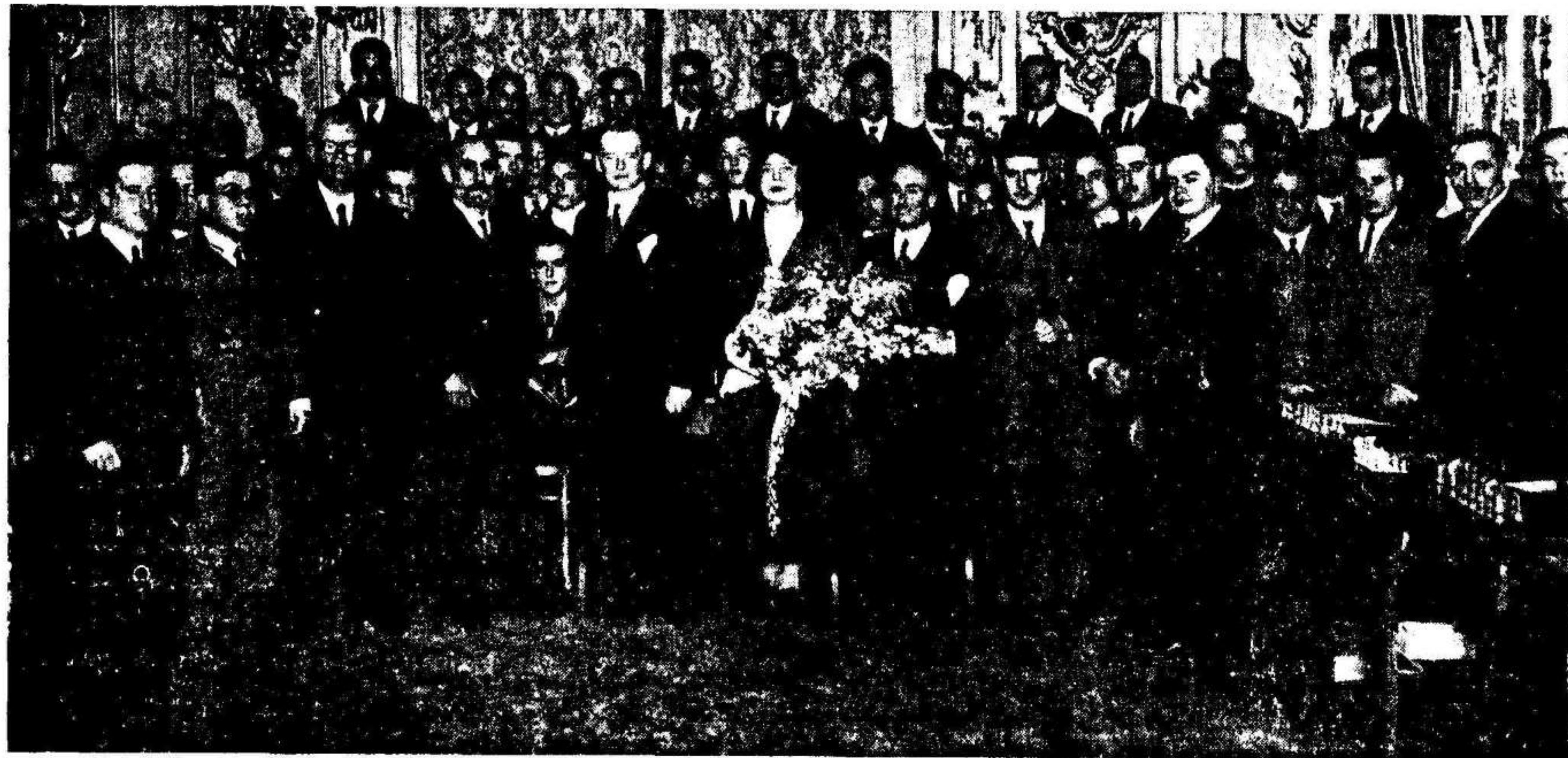
El campeón mundial de ajedrez Dr. Alekhine con su señora, Presidente del Casino y del «Club Golmayo» con los elementos que tomaron parte en las simultáneas celebradas en el Casino.