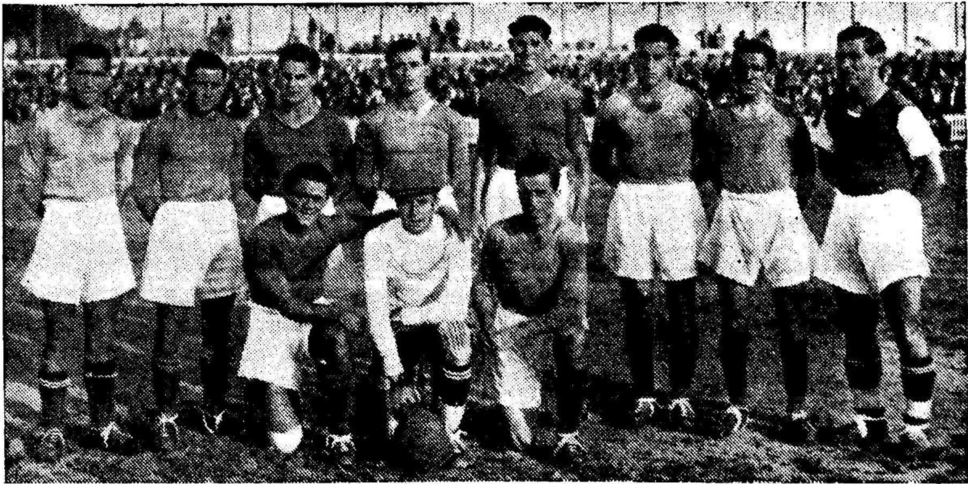
Equipo del Malacitano que venció al Murcia