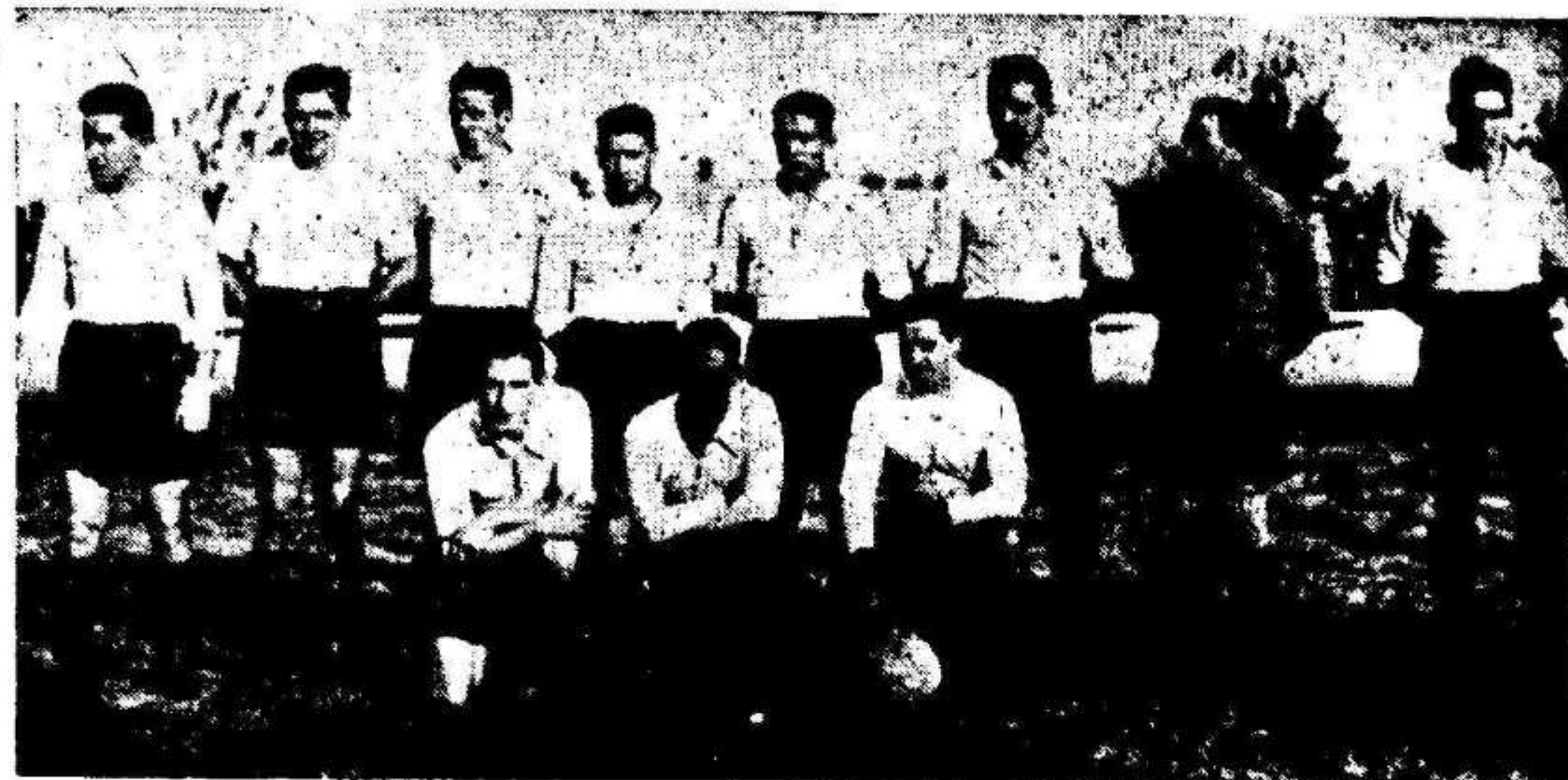
Equipo del Unión Club de Irún, que se ha proclamado campeón «amateur» de España.