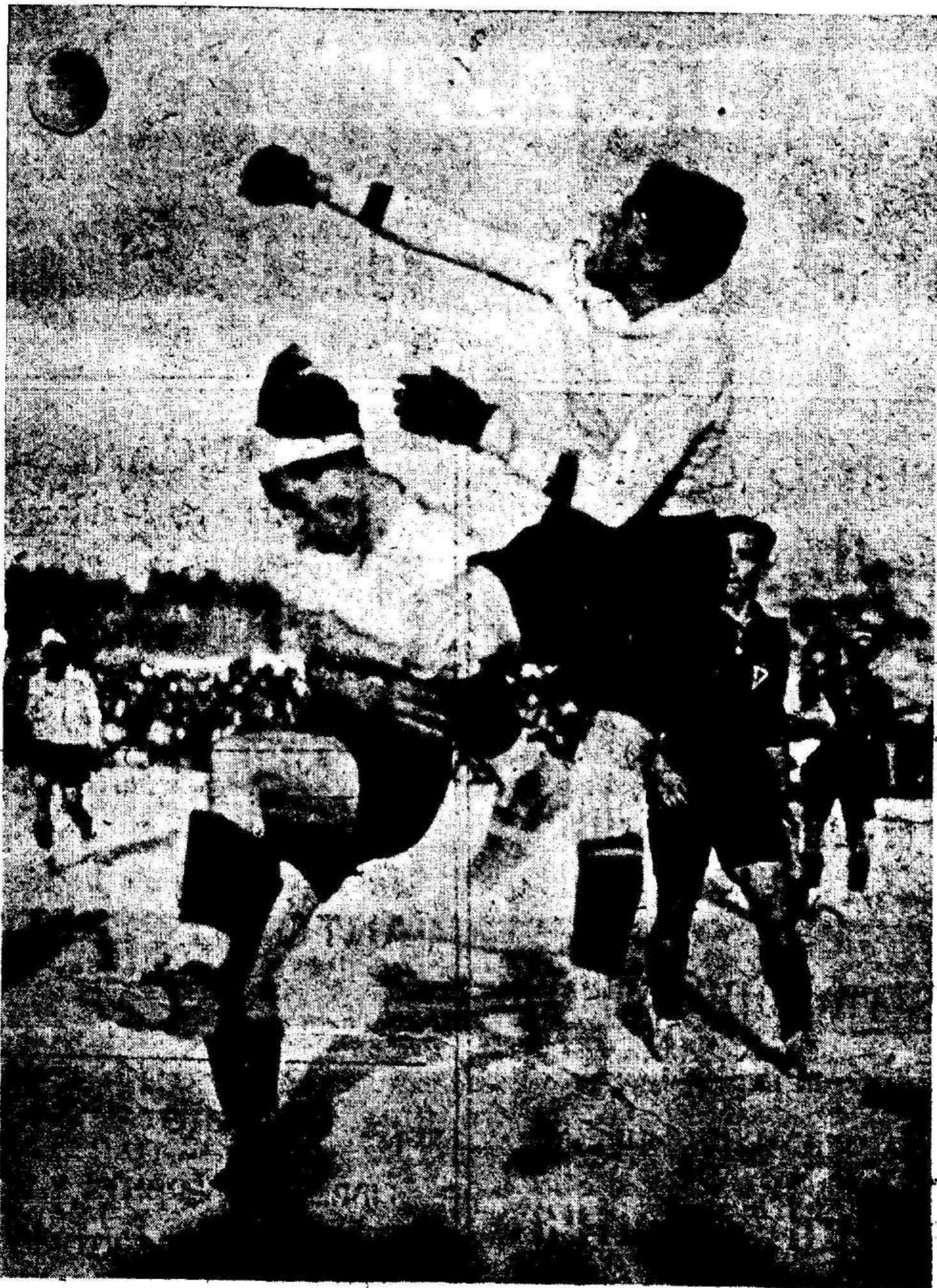
Un despeje de Enrique, el portero murciano, en el partido que jugaron ayer el Club Deportivo Cieza y el Murcia F. C., campeones regionales «amateur» y profesional respectivamente, que finalizó con la victoria de los ciezanos por la mínima diferencia.