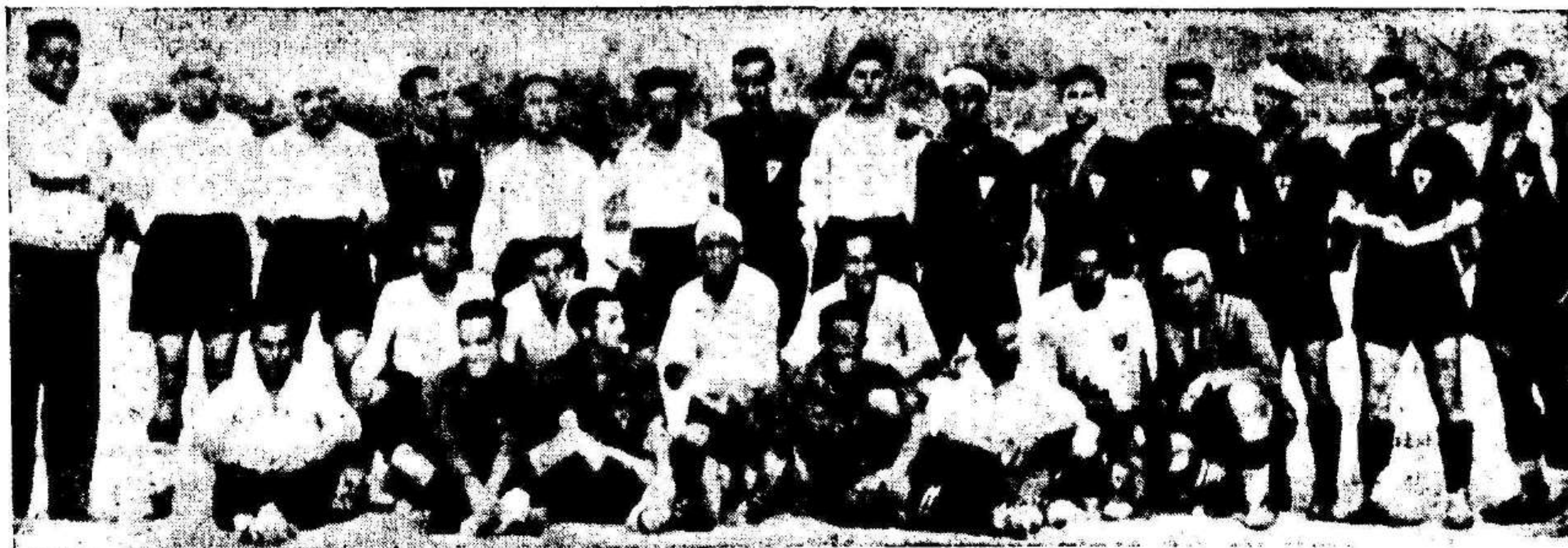
Los jugadores ciezanos y murcianos «posan», antes del encuentro, ante el objetivo de nuestro fotógrafo, Arenas