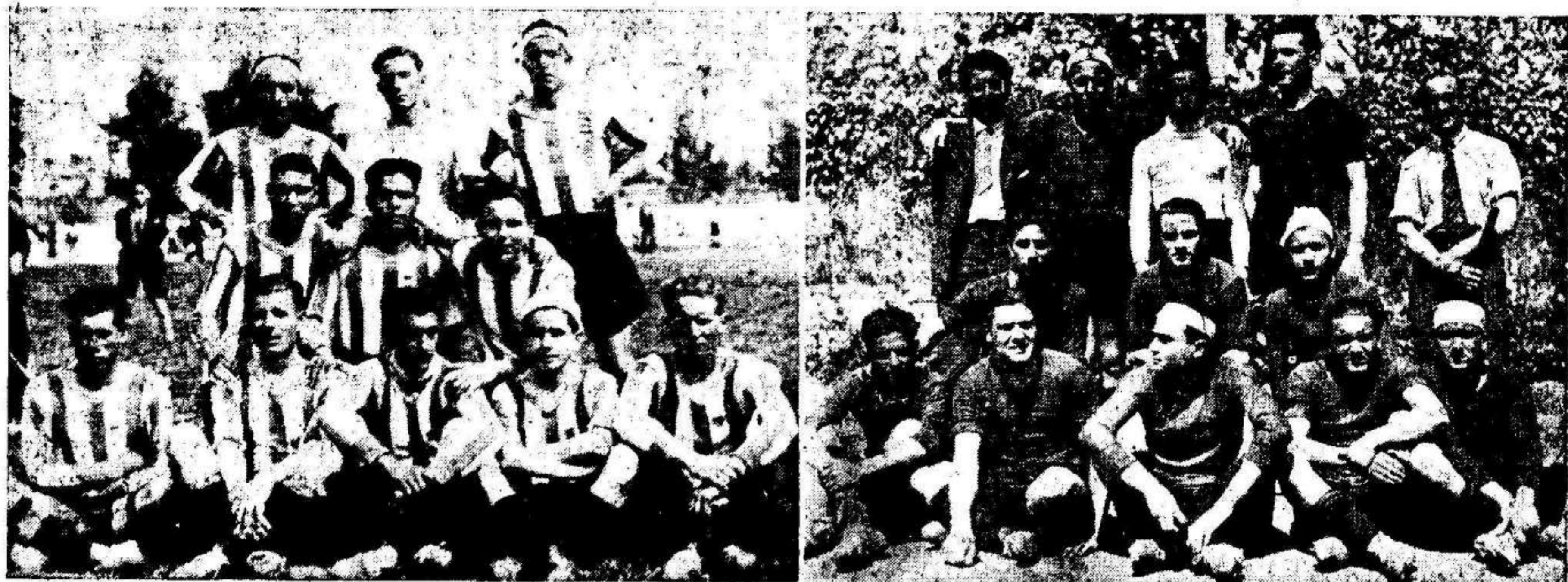
El Nacional de Espinardo (a la izquierda) que ayer obtuvo una brillante victoria sobre el Molina F. C. El Magister F. C. que figura actualmente como «leader» de su grupo.