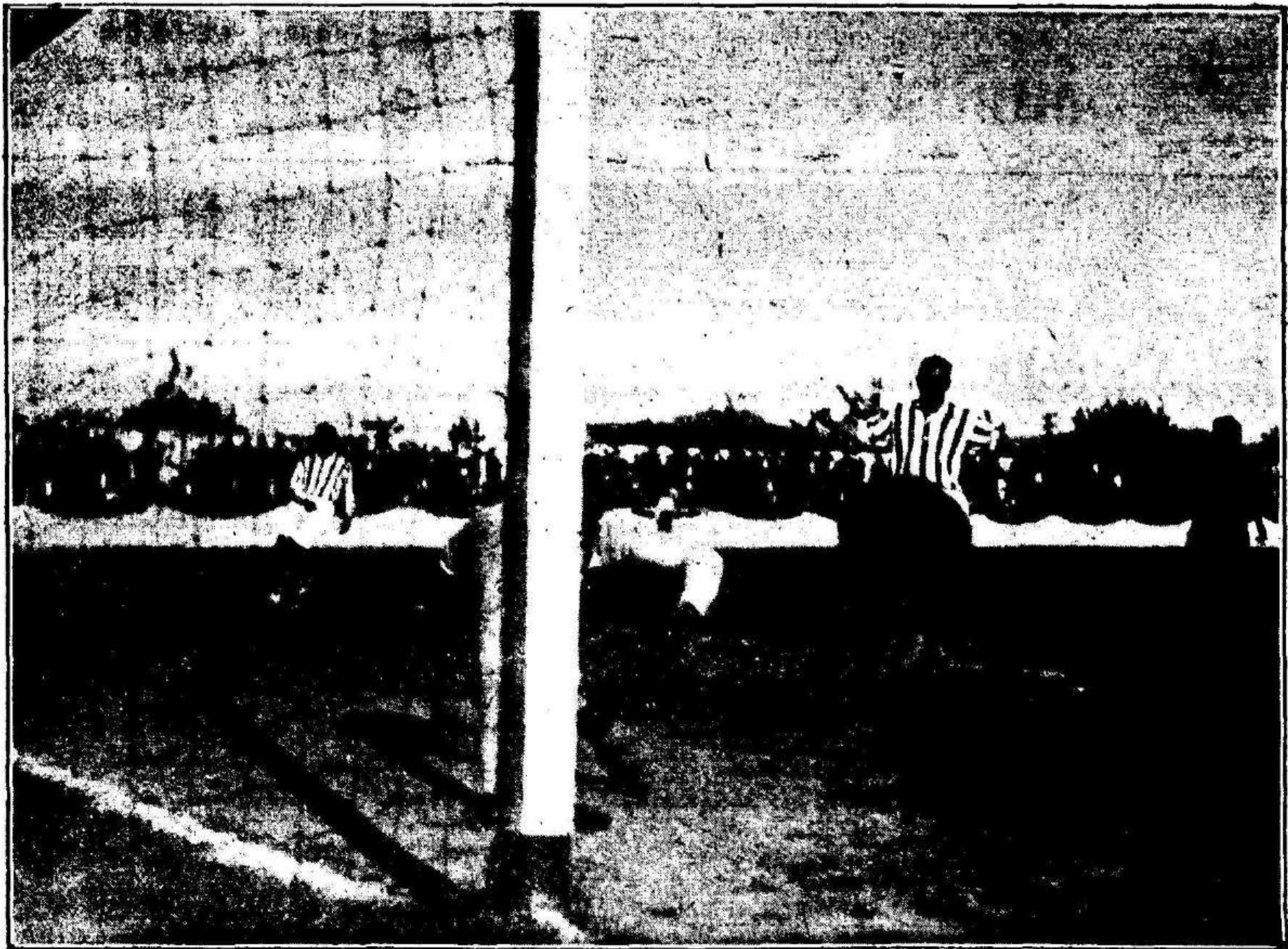
Un magnífico tiro de Zamera que Jesús desvía apuradísimo a corner