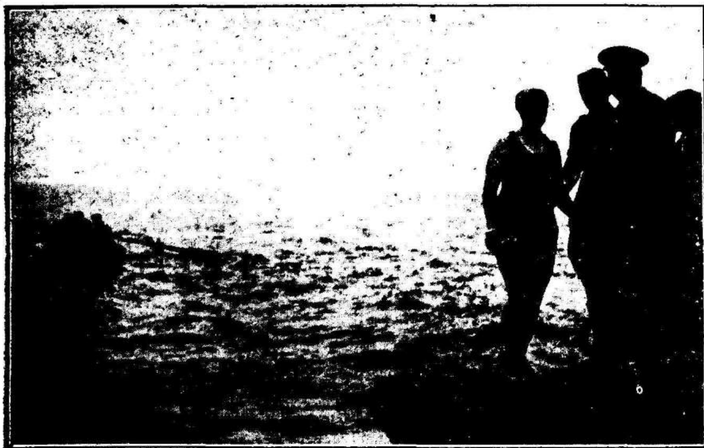
La famosa nadadora inglesa Miss Mercedes Gleitze en las costas de Tarifa momentos antes de iniciar la travesía del Estrecho el día 5 de Abril y en la que invirtió 12 horas 55 minutos