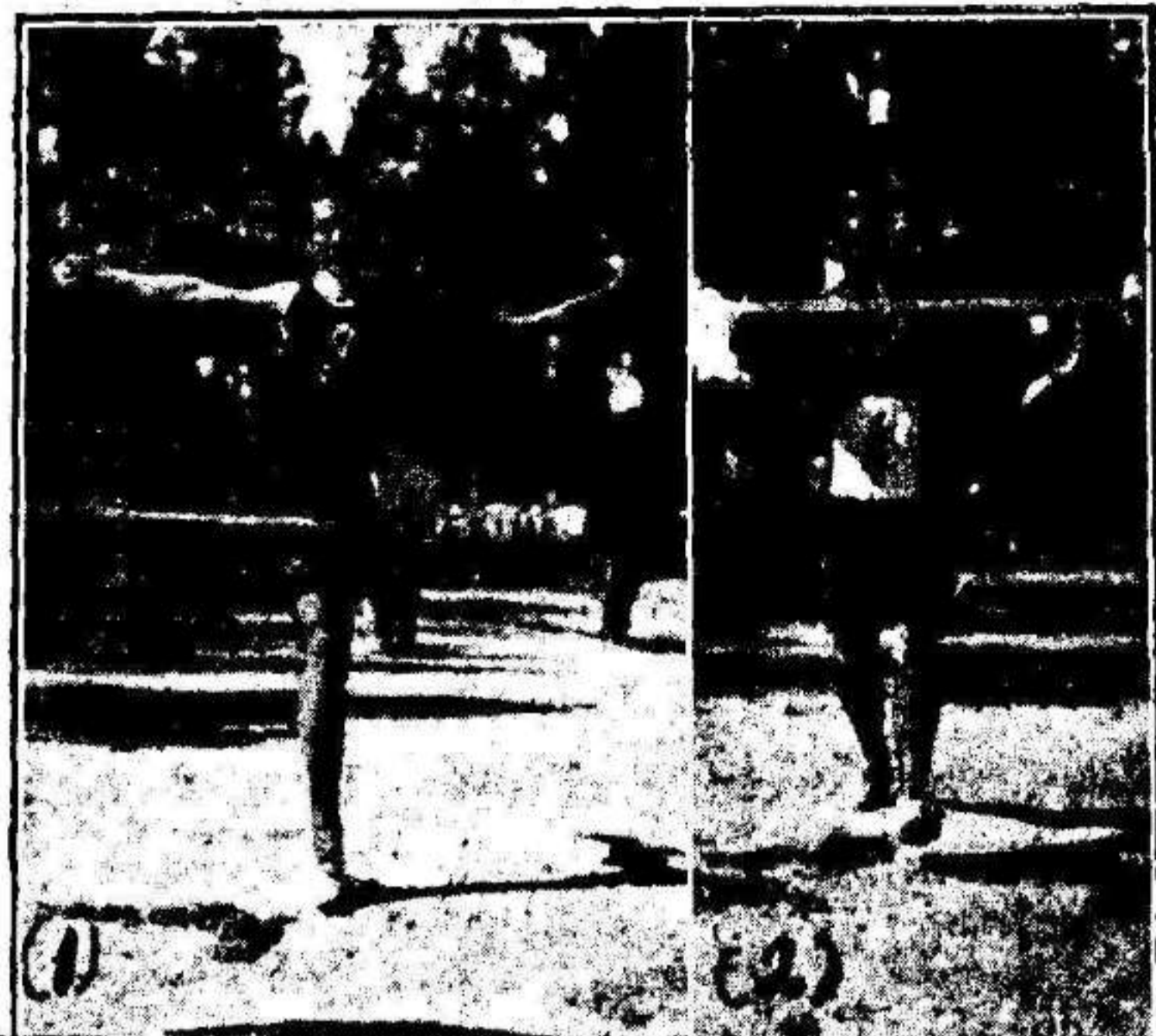
Tres momentos del IV Croos Regional murciano.

El público muy escaso y poco propicio a prodigar aplausos. Sólo a los suyos de vez en cuando; a los madrileños ni una vez han sido obsequiados con los que merecan muchísimas jugadas.— A pesar de ello sin extri-