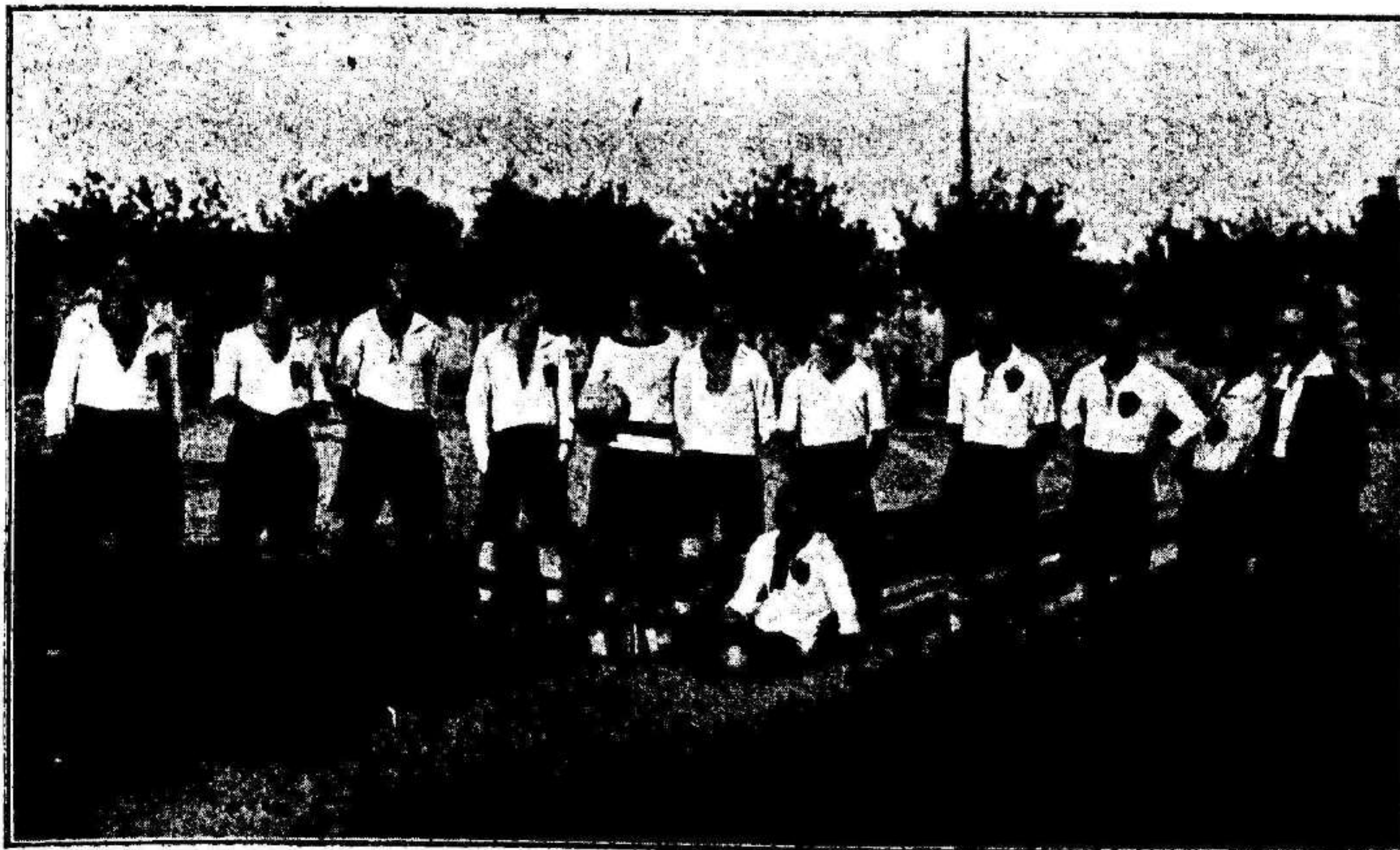
Equipo del Club Deportivo de Castellon, que ha sido vencido en dos encuentros por el Real Murcia

Novedades - Tejidos DE FELIPE CARRILLO FERNANDEZ Príncipe Alfonso núm. 50 - Teléfono, 686 MURCIA