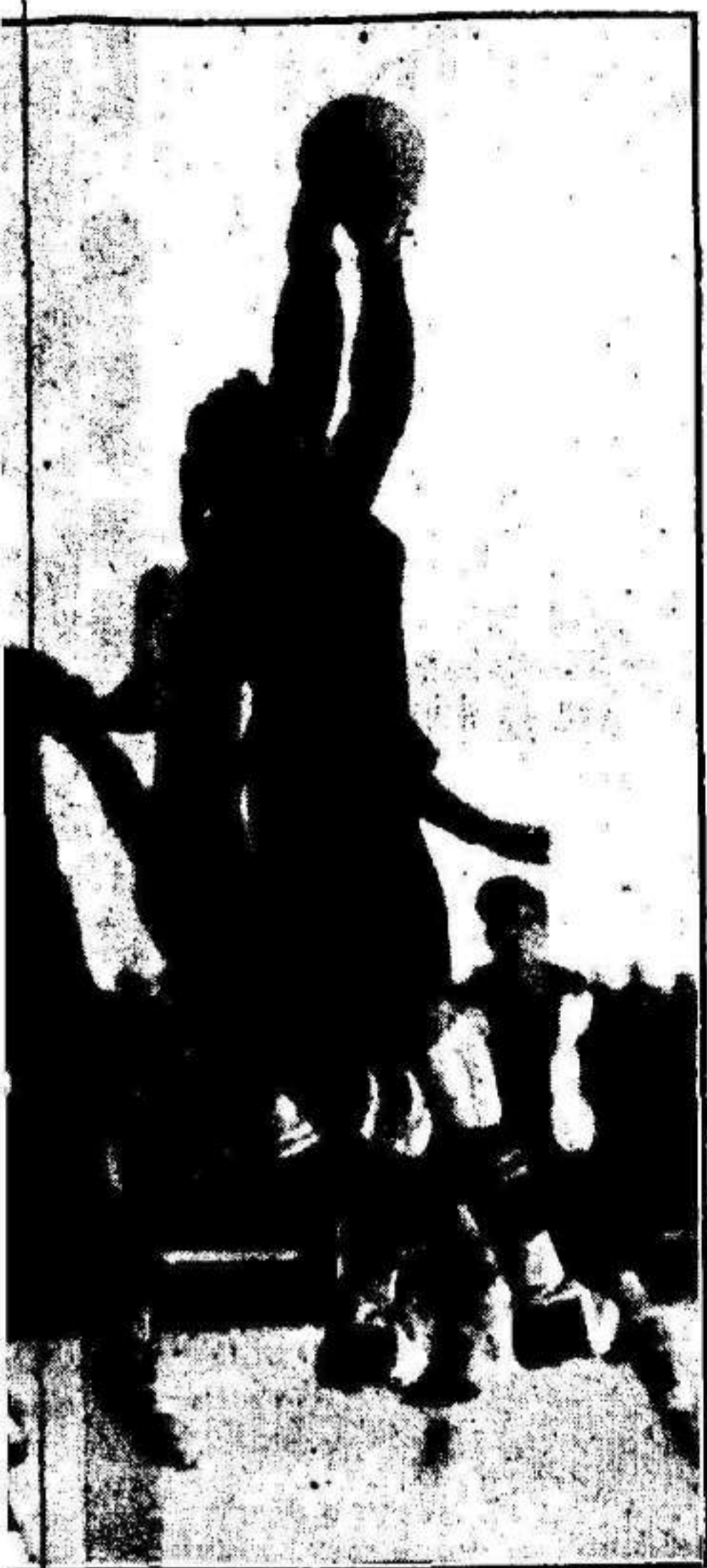
ción-Murcia e Josep al despejar un corner