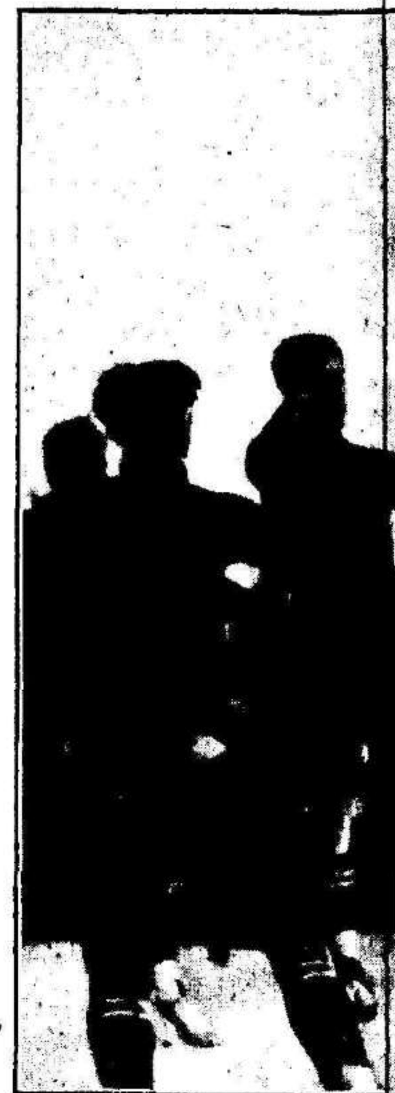
Nat El estilo inimitable de

PARA DAR LA EXTENSIÓN MEREVIDA A LOS ACONTECIMIENTOS DEL PRÓXIMO NÚMERO, QUE IRÁ DEDICADO A ORIHUELA, EN TEXTO Y FOTO