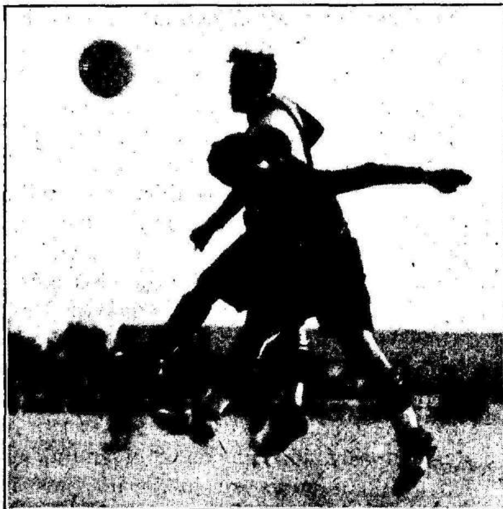
Natación-Murcia El duelo Albaladejo Calvo por la posesión del balón.

Y el caciquillo deportivista dice en una entrevista a raíz del partido, que ya nunca más le ganaría el Real Murcia al Natación.