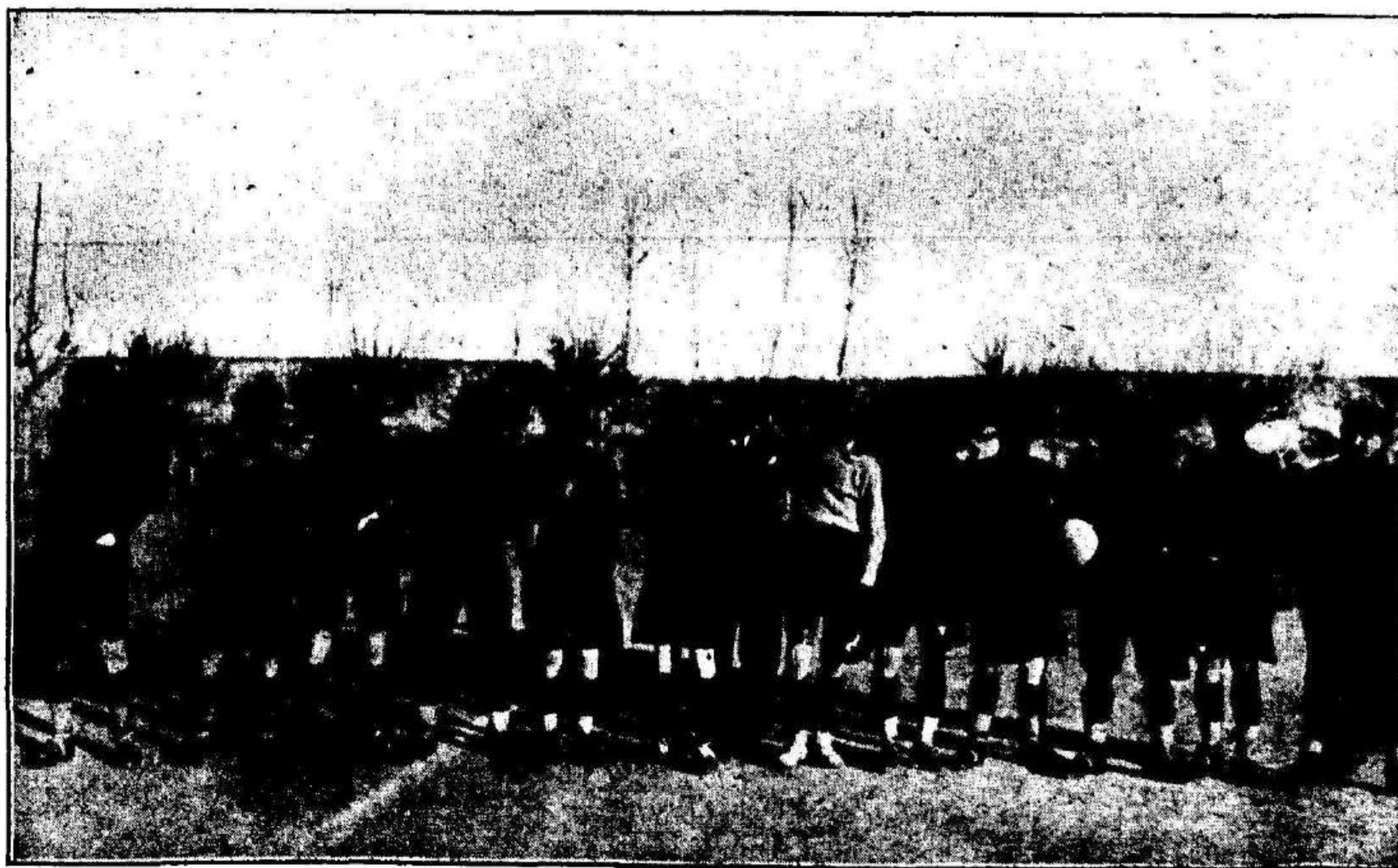
Equipo de la Unión Sporting de Madrid que ha jugado tres interesantes partidos en las pasadas Navidades con el Real Murcia