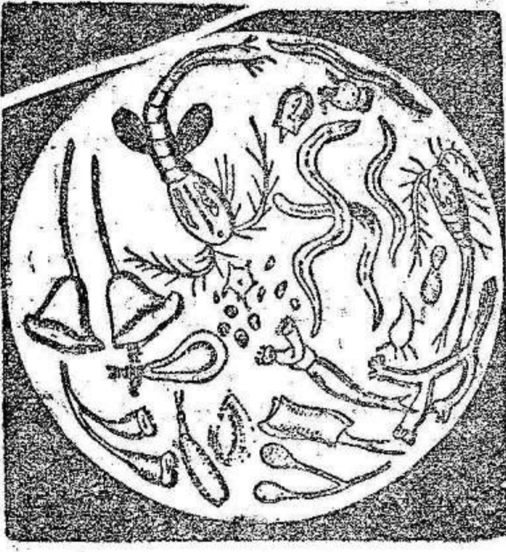
MICROBIOS destruidos por el Alquitrán-Guyot