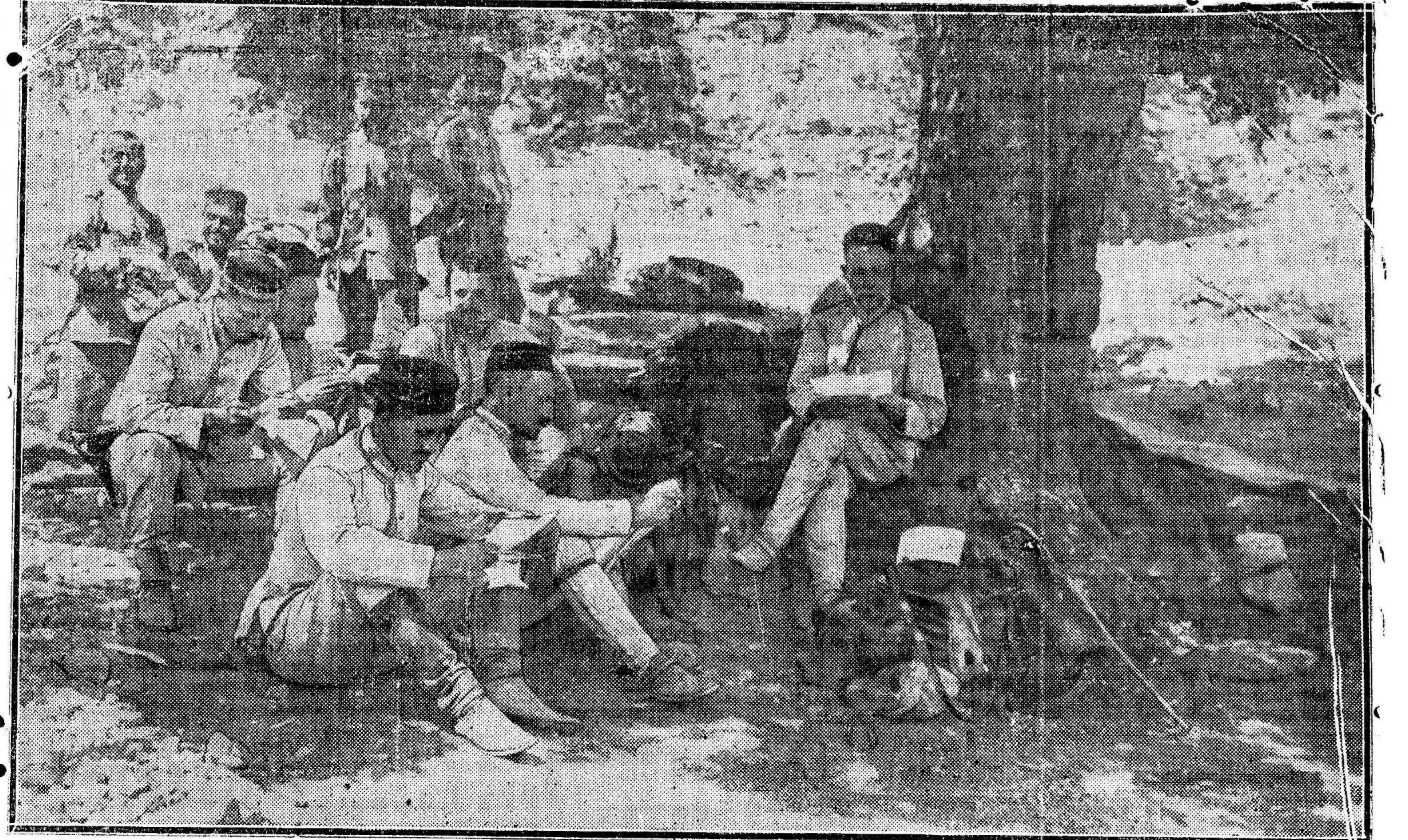
UN GRUPO DE OFICIALES LEYENDO EL CORREO

Este les mostró su completa conformidad sobre la necesidad de una acción común de todos los elementos democráticos para atajar la política clerical del Gobierno.