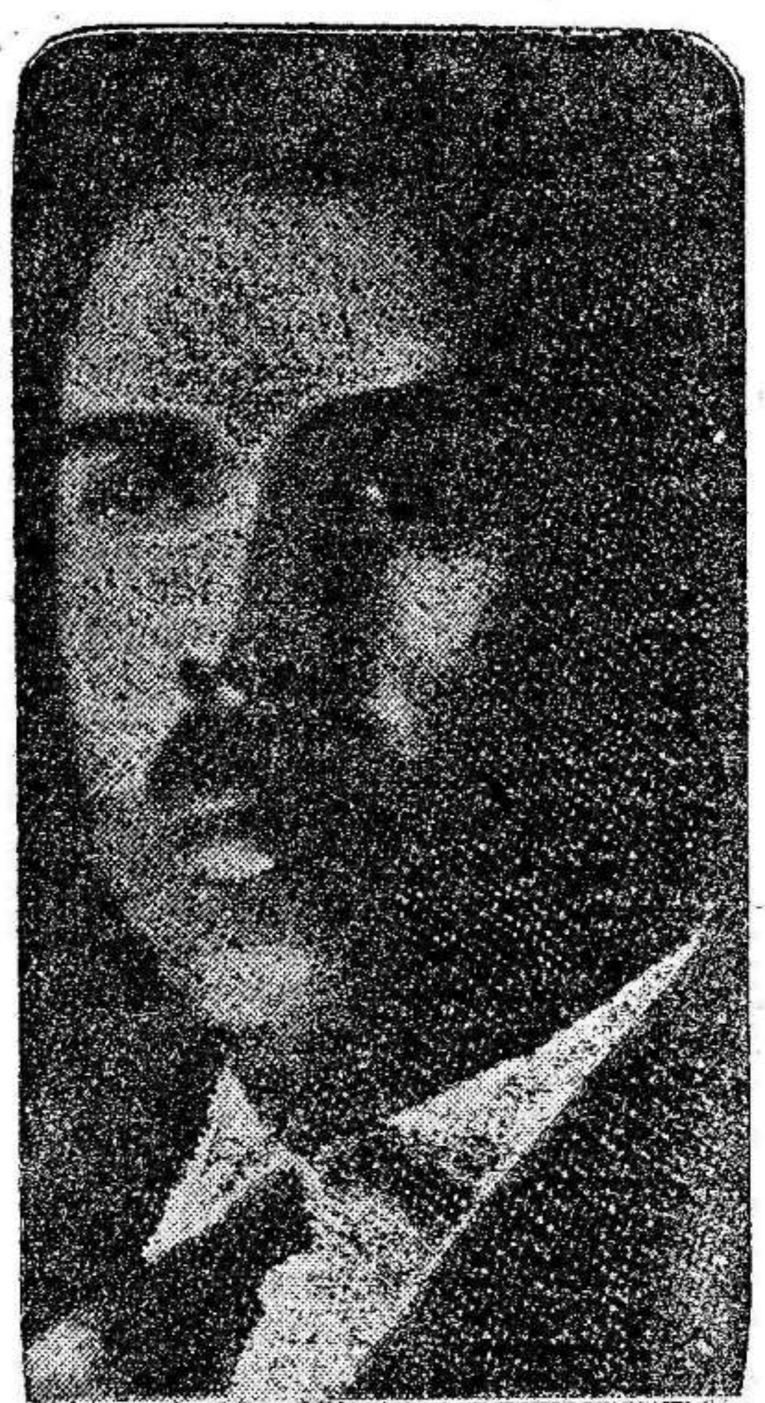
MEJICO, 13.—El presidente Cárdenas, además de renunciar a sus poderes extraordinarios para 1938, ha presentado un proyecto de reforma de la Constitución que prohíbe la concesión de poderes extraordinarios al presidente de la República, salvo en el caso de acontecimientos que pongan a la nación en peligro, para evitar la amenaza de convertir en dictadura personal el sistema republicano, democrático y federal.—Febus.

BARCELONA, 13.—En el ministerio de Defensa ha sido facilitada la siguiente nota: "Según informes remitidos por el comandante militar de Alicante, parece que la embarcación cuyo incendio fué visto en la noche del viernes era un barco de pesca llamado "Teide número 1", de cincuenta y tres toneladas, movido a motor de gasolina, y perteneciente a la matrícula de Villajoyosa, del cual no se ha podido encontrar rastro."—Febus