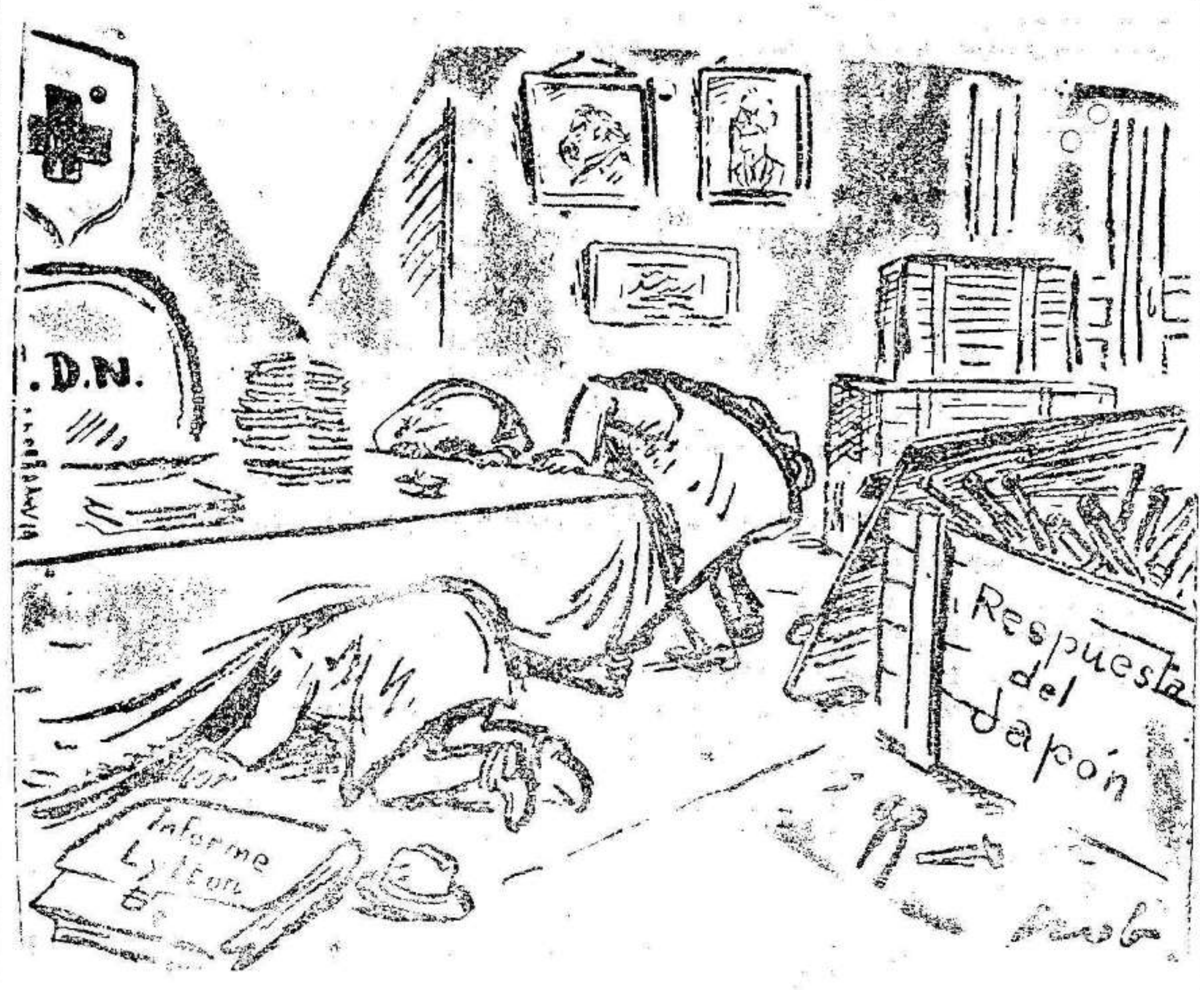
¿DONDE ESTA LA SOCIEDAD DE NACIONES?

2 Suscríbese a EL LIBERAL pesetas al mes