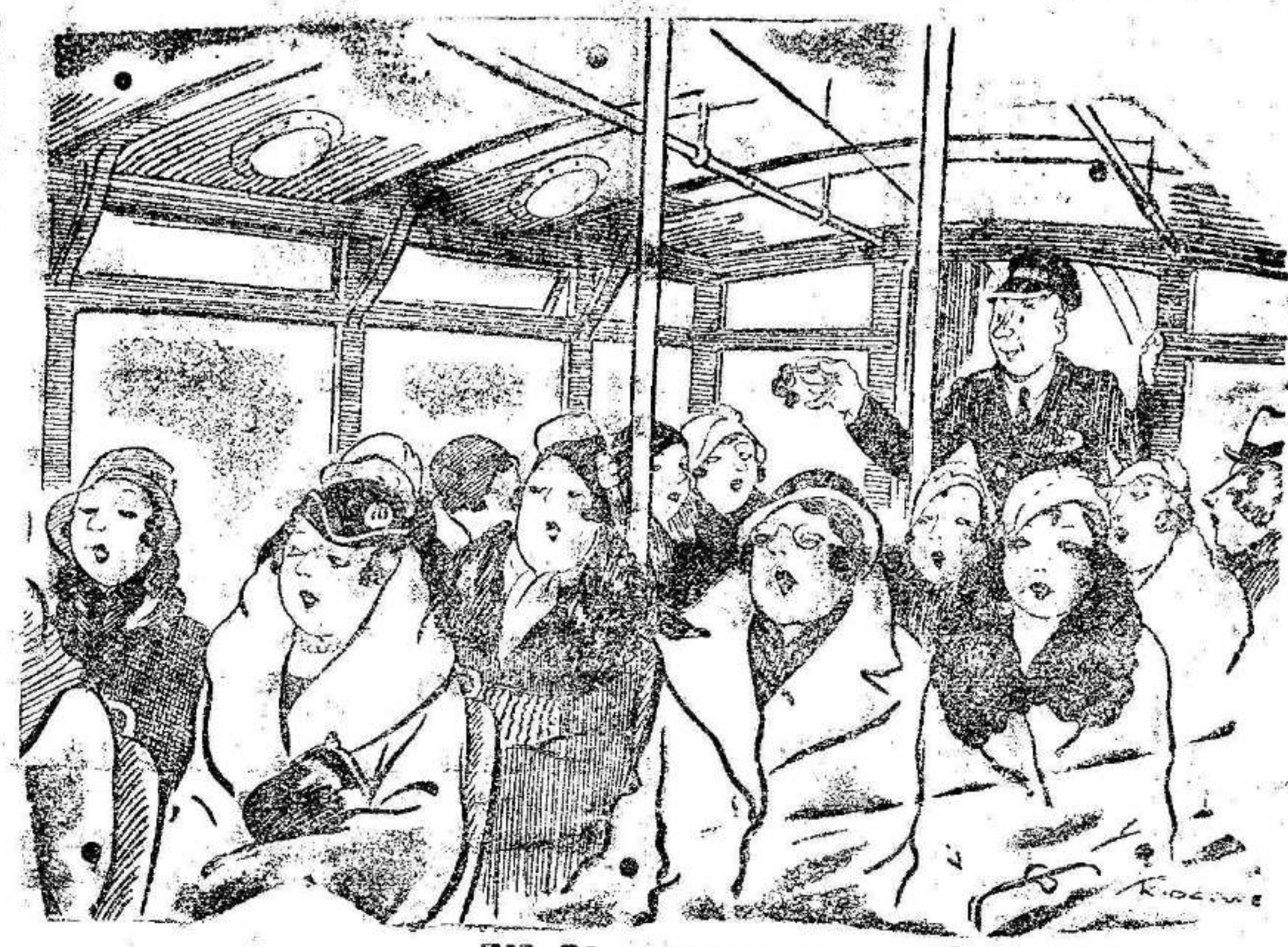
EN EL AUTOBUS El cobrador (con un rizo en la mano)—¿A alguna señora se le ha caído un postizo.