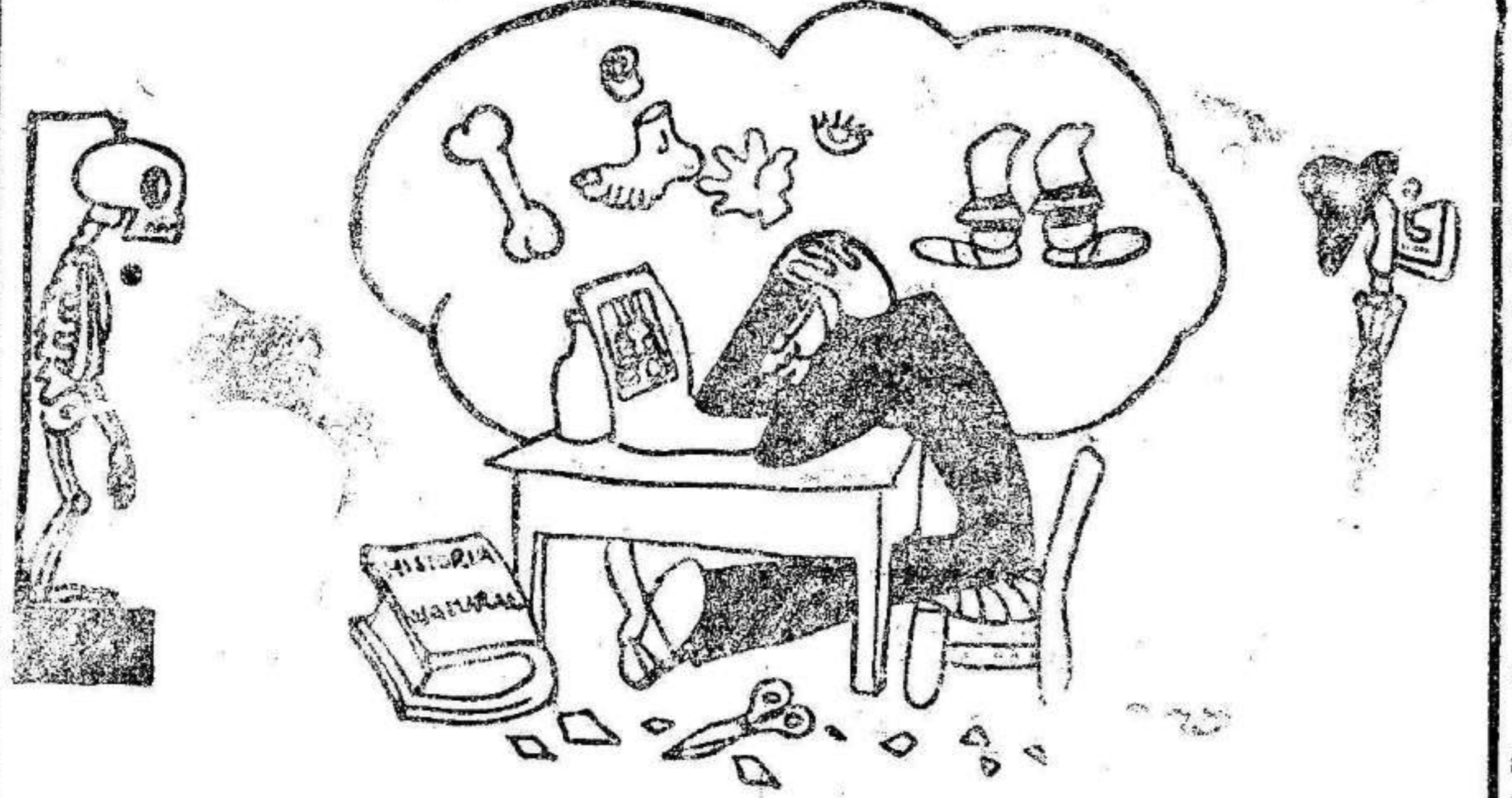
Las primeras preocupaciones de los directivos desde los primeros encuentros de la Liga de fútbol.

una de las pocas jugadas bonitas de la tarde. Se castigó al Coruña con un fault cerca del centro del campo. Lo sacó Mondragón, y en el despeje el balón volvió a sus pies. Ahora, el mismo jugador bombeó el balón hacia Zamora, que lo recogió en el aire, y lo pasó a Romero. Este lo desvió de cabeza, y Julio lo empalmó antes de que llegara al suelo, batiendo por única vez a Rodrigo. El público se lanzó al campo, en su entusiasmo, abrazando a Julio, el jugador al que algunos técnicos de la directiva señalaron por compasión, al principio de la temporada, un sueldo de veinticinco o treinta duros.