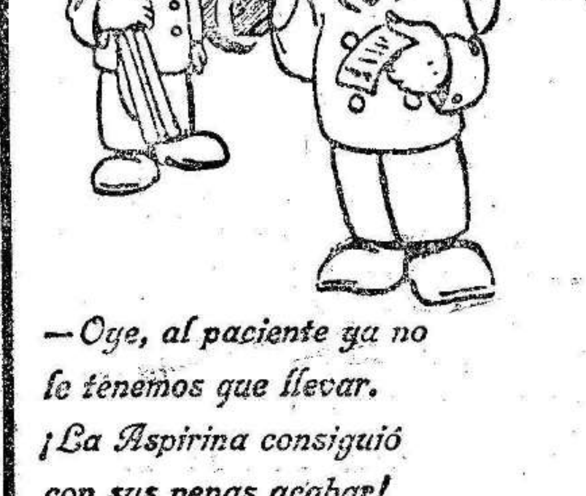
—Oye, al paciente ya no le tenemos que llevar. La Aspirina consiguió con sus penas acabar!

Nos consta—agrega—que ha hecho pedidos de libros de literatura rusa. Recientemente ha hecho un pedido de libros sobre política social soviética, sobre todo del plan quinquenal soviético.