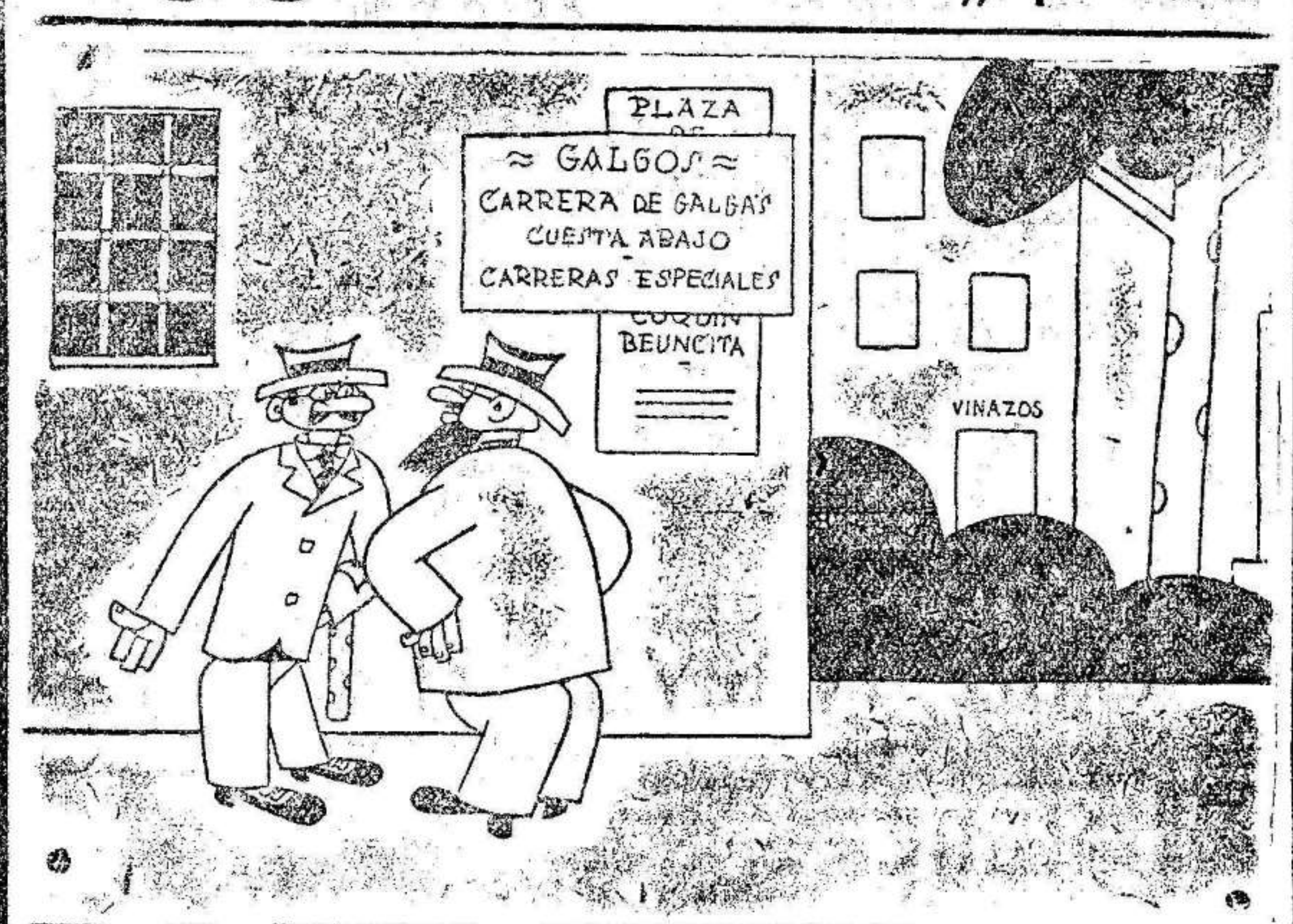
—Era verdaderamente escandaloso, porque echar una tarde «a perros» para quedarse sin una «perra».