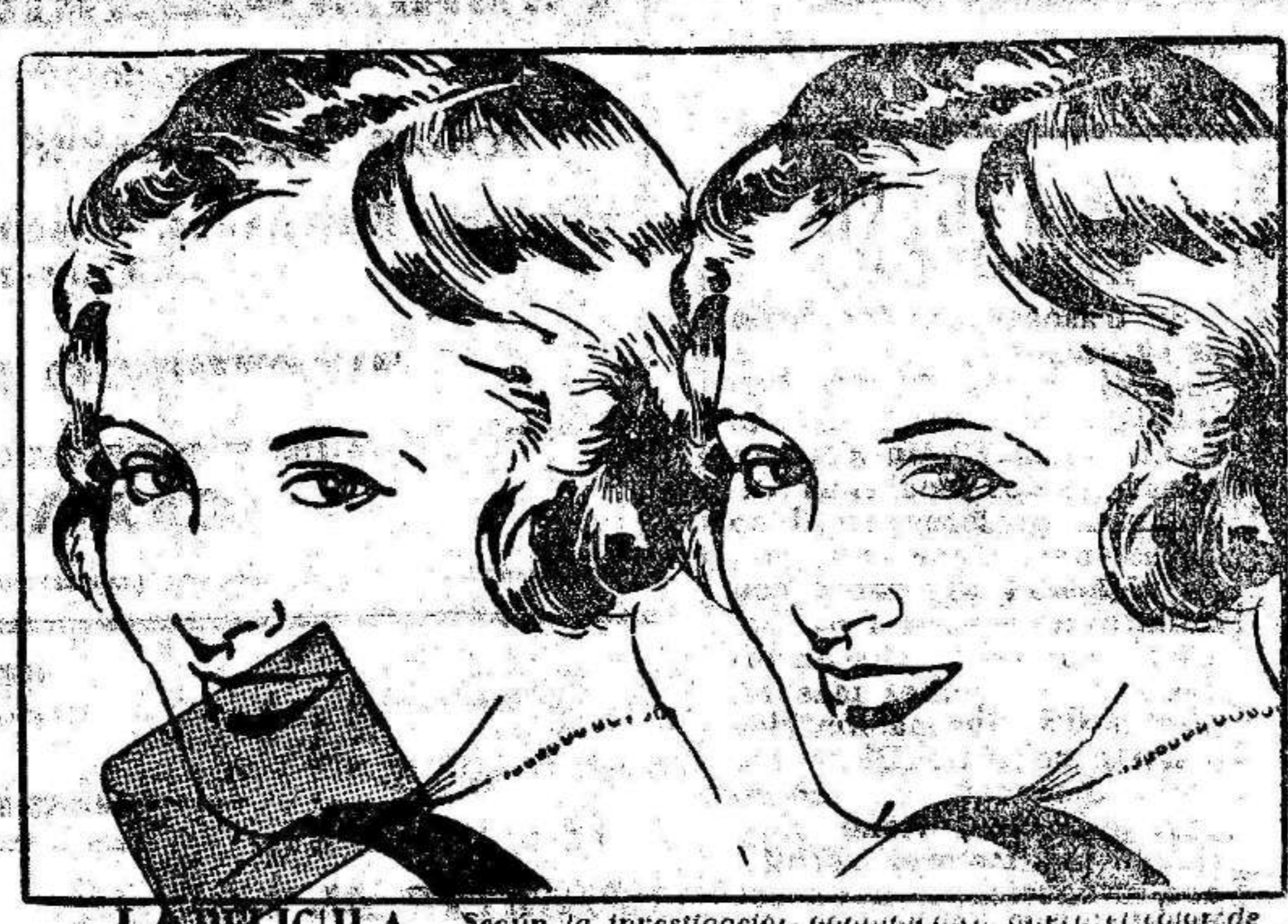
LA PELICULA. Según la investigación, ocurren en una película de los dientes y provocan serias dolencias en la dentadura.