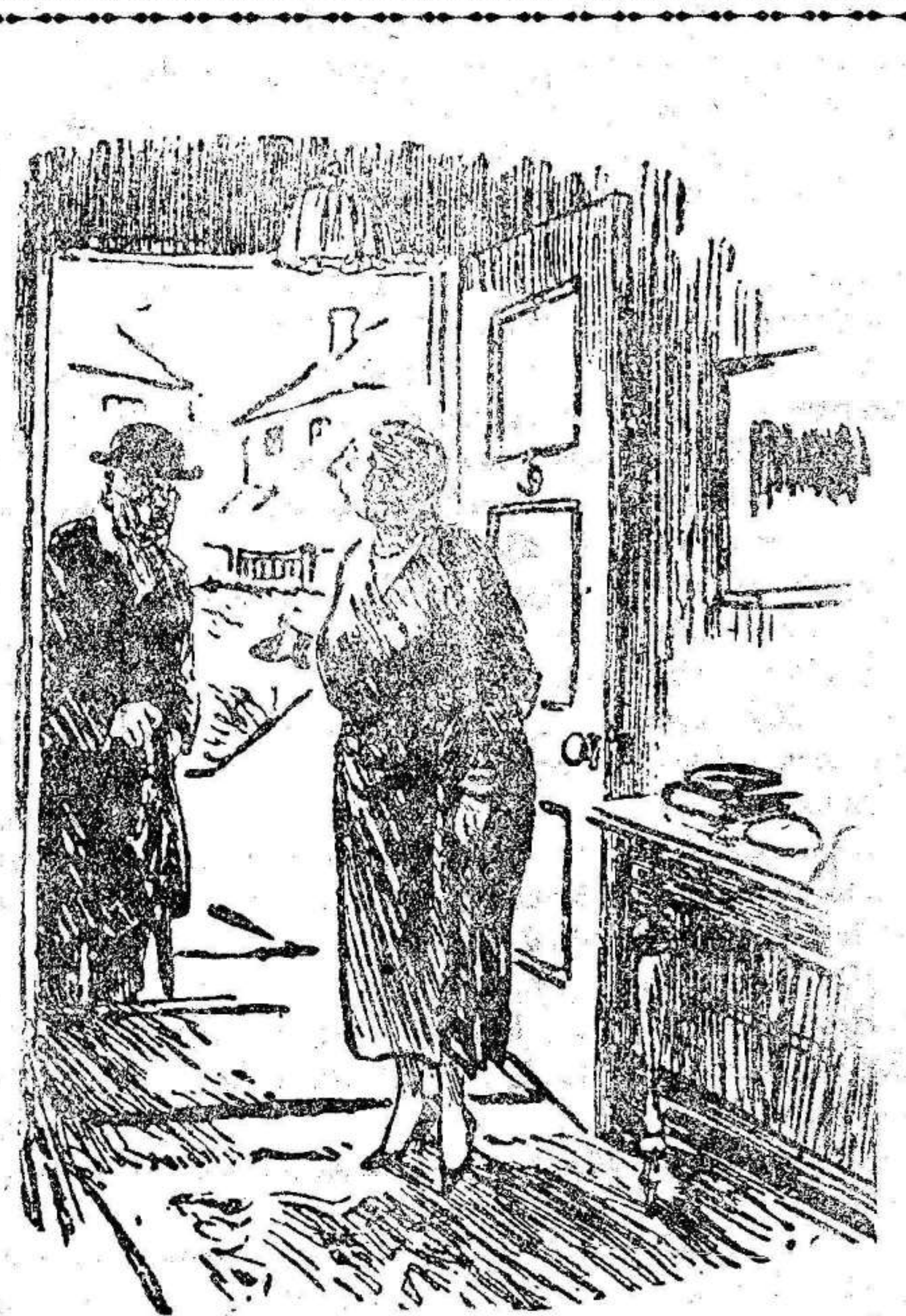
LA SEÑORA (al inspector).—Bueno, pues si le molesta mi altavoz, váyase a vivir a otra calle. EL INSPECTOR.—Pero si yo vivo en otra calle, señora.