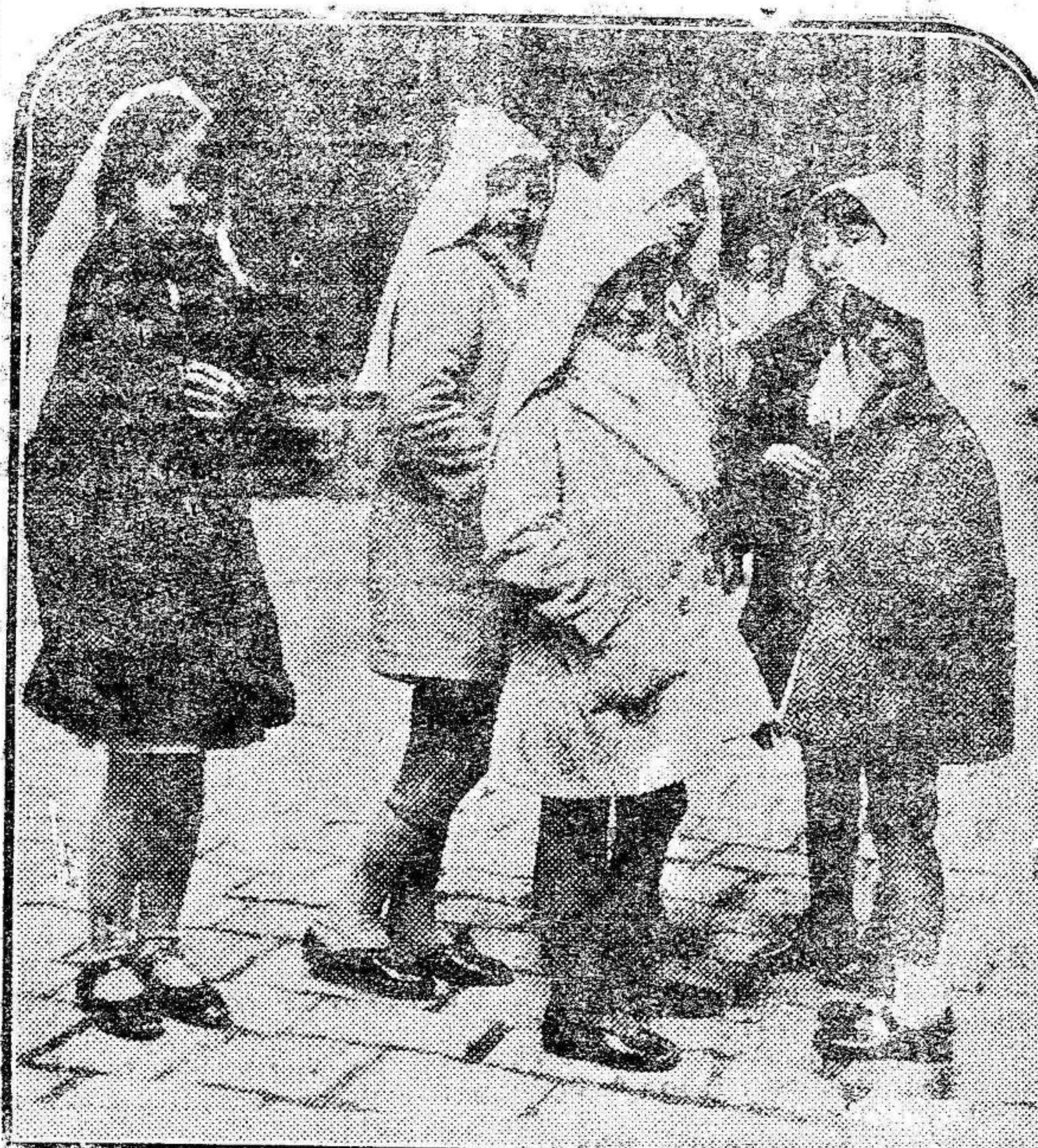
La clásica «caputxa» catalana se ha reintegrado a la vida barcelonesa después de dos años de sequestro, de reclusión forzosa, impuesta por la dictadura de Primo de Rivera.