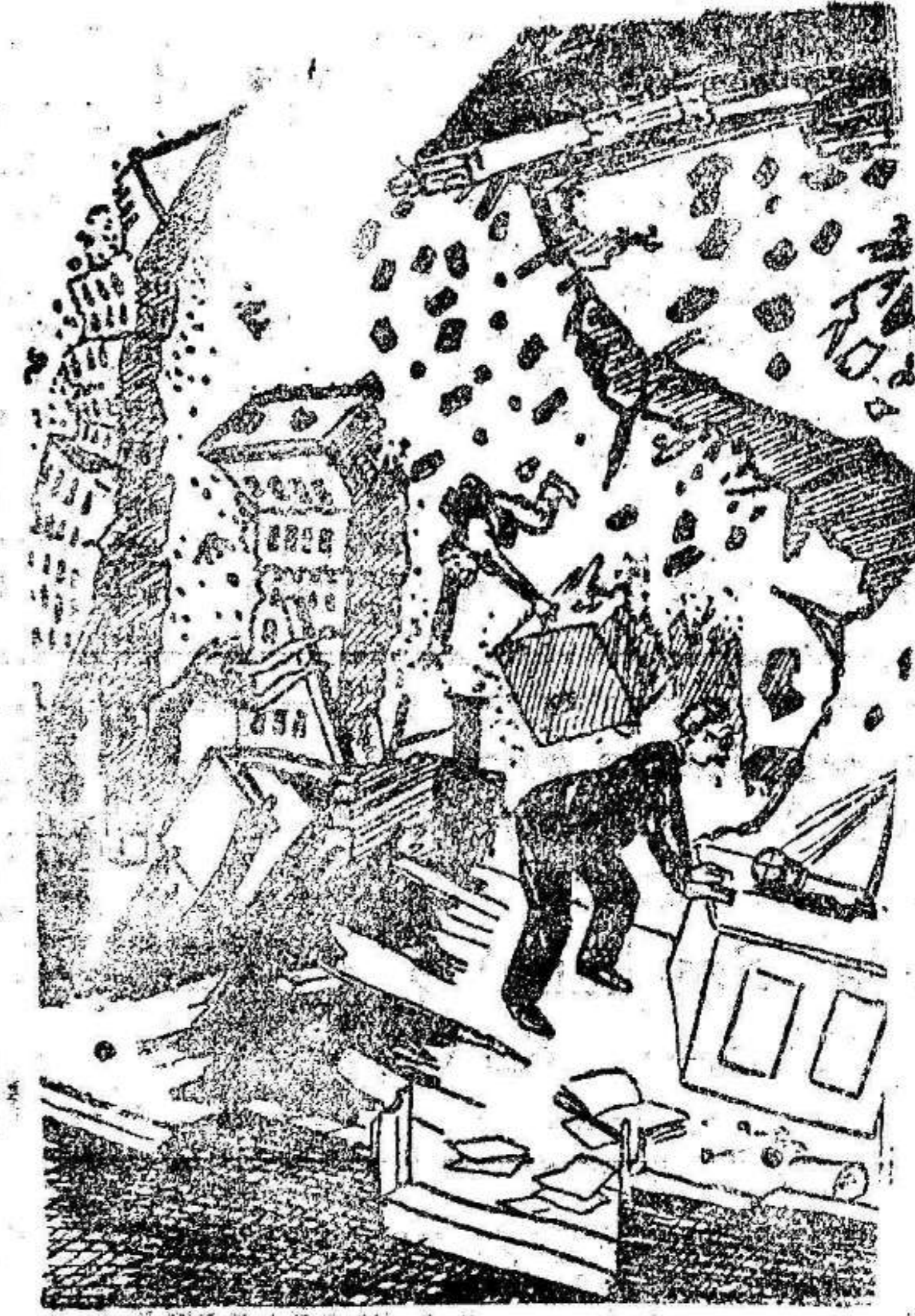
EL SABIO.—El sismógrafo vibra. Debe haber un temblor de tierra en alguna parte.

LEGITIMA DANESA LA PREDILECTA DE LOS INTELIGENTES